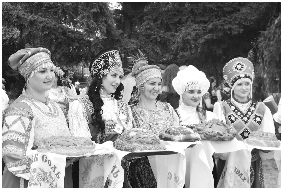
В России умеют воздавать честь настоящим труженикам. Хлебные караваи на выставке - как подтверждение богатого Самарского края.

Каждый муниципалитет готов был показать главе региона свою изюминку, чем славится их край, угостить своей