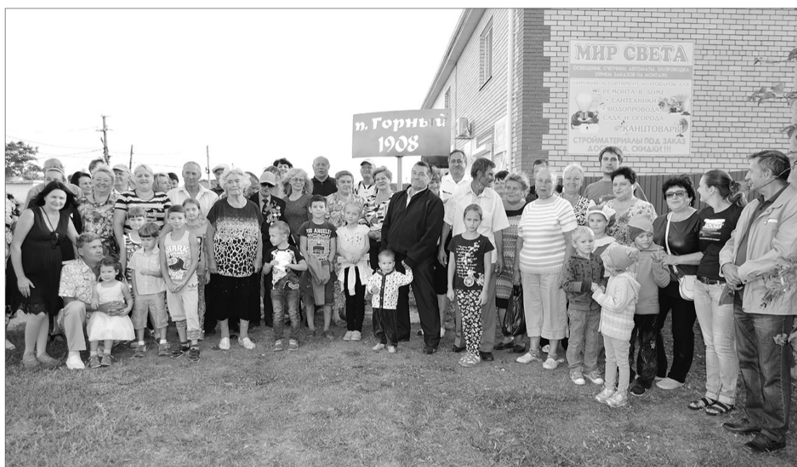
Теперь у жителей поселка Горный есть памятный знак - место, где собраться. Что и сделали все, кто пришел на праздник.

ПОСЕЛОК ГОРНЫЙ ОТПРАЗДНОВАЛ СВОЙ ПЕРВЫЙ ДЕНЬ РОЖДЕНИЯ И СРАЗУ ОТМЕТИЛ 110-ЛЕТИЕ