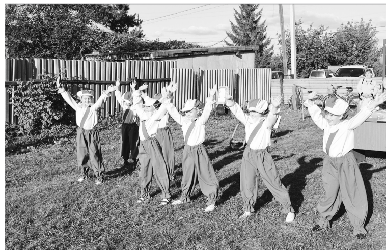
Лучшие артисты лета - это дети!