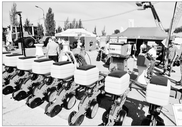
Значительное пространство экспозиционных площадок было отведено производителям сельскохозяйственной техники. Такое количество машин, агрегатов, оборудования здесь было представлено впервые и стало особенностью юбилейного агрофорума.