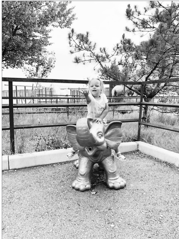
Алена в белогорском сафари-парке «Тайган». Это крупнейший в Европе питомник львов и других животных. Расположен на берегу Тайганского водохранилища в Белогорском районе Крыма.