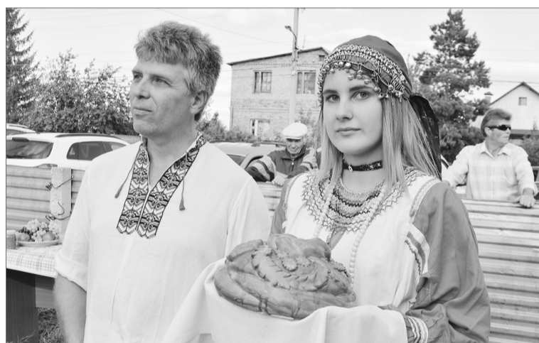
По русскому обычаю гостей встречали хлебом-солью.