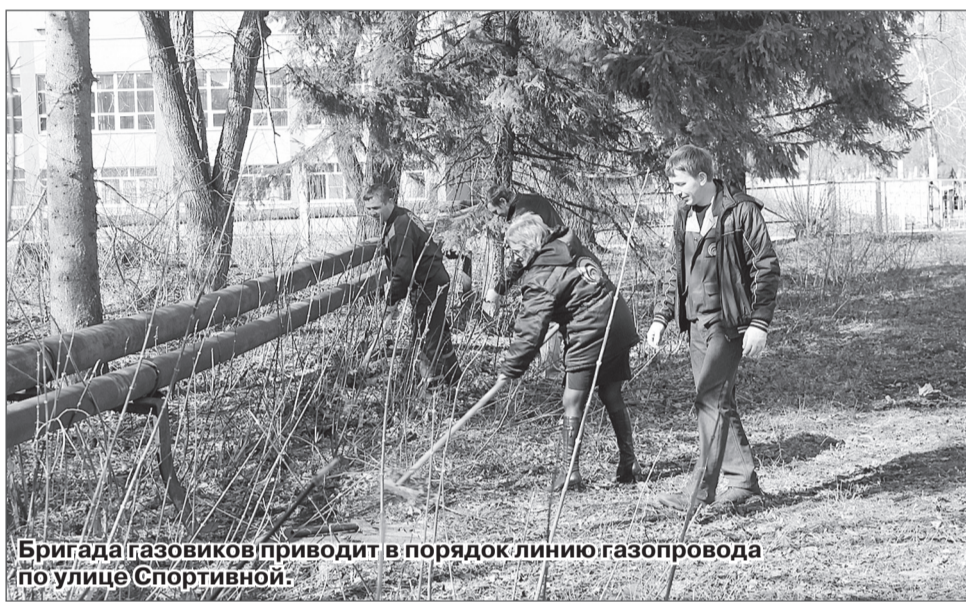
Бригада газовиков приводит в порядок линию газопровода по улице Спортивной.

Болит душа хозяйственных общественников и за участки теплотрассы, на которых с течением времени нарушилась теплоизоляция. Здесь есть заметные продвижения: коммунальщики отремонтировали трубы у котельной, по улицам Селекционная, Транспортная и на других участках. Но и тут задается вопрос об имущественной принадлежности. Часть теплотрасс принадлежит конкретным предприятиям, частным предпринимателям, а вот заставить их привести в порядок свое хозяйство не так-то просто.