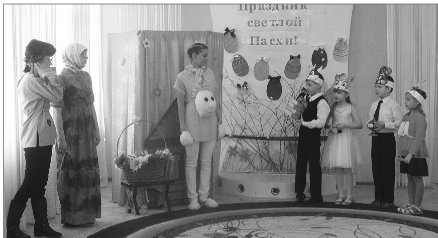
Известная народная сказка на новый лад была тепло принята детьми и взрослыми.

ствовали в выставке декоративно-прикладных работ пасхальной тематики. Воспитатели в группах и специалисты детского сада на своих занятиях провели с воспитанниками серию бесед о Пасхе, о том, как православные готовятся к ней, и о великой радости людей в День Воскресения.