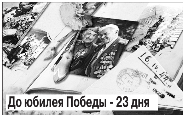
До юбилея Победы - 23 дня