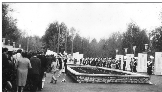
1985 год. К 40-летию Победы обелиск в нашем городе был реконструирован.

Грядущий праздник является свидетельством не только беспримерного героического подвига и даты в истории Великой Отечественной войны. День 9 Мая символизирует собой священный завет уходящего поколения победителей - помнить, знать и гордиться.