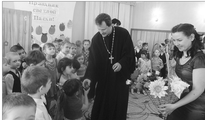
Пасхальный подарок для каждого участника праздника.

Мы, взрослые, естественно, думаем о будущем поколения, которое сейчас называется - наши дети. Мы, взрослые, - те, кто занимается воспитанием детей профессионально, с самого раннего, самого важного возраста, наверное, как никто другой осознаем свою ответственность перед этим самым будущим. Что посеем и что потом пожнем? Разумное, доброе, вечное или...? Что мы можем дать детям, чему мы их научим, какие примеры им подадим, - вот вопросы, которые требуют от нас безотлагательных ответов, как говорится, здесь и сейчас.