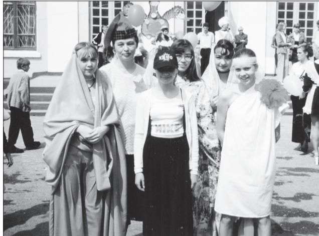
Радость прошедших лет хранят и школьные фотографии в домашнем альбоме, где собраны свидетельства самых важных событий в нашей жизни.

Думаю, сотни ребят и девочек - выпускников