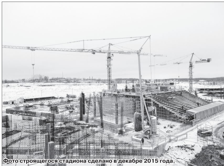
Фото строящегося стадиона сделано в декабре 2015 года.

«С требованиями такого уровня, которые предъявляет FIFA, нашему городу еще работать не приходилось, - отметил министр спорта. - Но даже с учетом непростой экономической ситуации, грамотное расставление приоритетов при реализации проектов подготовки к Чемпионату мира позволит нам справиться с поставленной задачей».