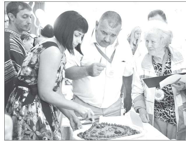
Фирменное блюдо от семьи Злобиных из Богатовского района - ягодный пирог.