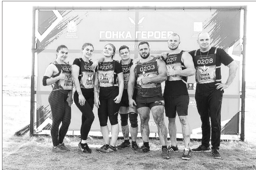
«Сложно, но интересно!», - говорят кинельские ребята о «Гонке героев».

О том, насколько трудна была трасса, можно судить по «содержанию» препятствий. Если первое испытание - подъем по наклонной горе - участники преодолели довольно бодро, то второе стало уже серьезной проверкой на силу и выносливость. Хватаясь руками за кольца и канаты, предстояло пройти над импровизированным озером. Дальше - еще труднее: вскарабкаться на высокую лестницу, перекладыны которой сделаны из цепочек, окунуться в яму с водой, забраться по канату, проползти по окопам и перебраться с места на место тяжелые автомобильные покрышки. Напоследок организаторы подготовили испытание, которое в большей степени направлено на психологическую выдержку «героев». Участникам нужно было про-