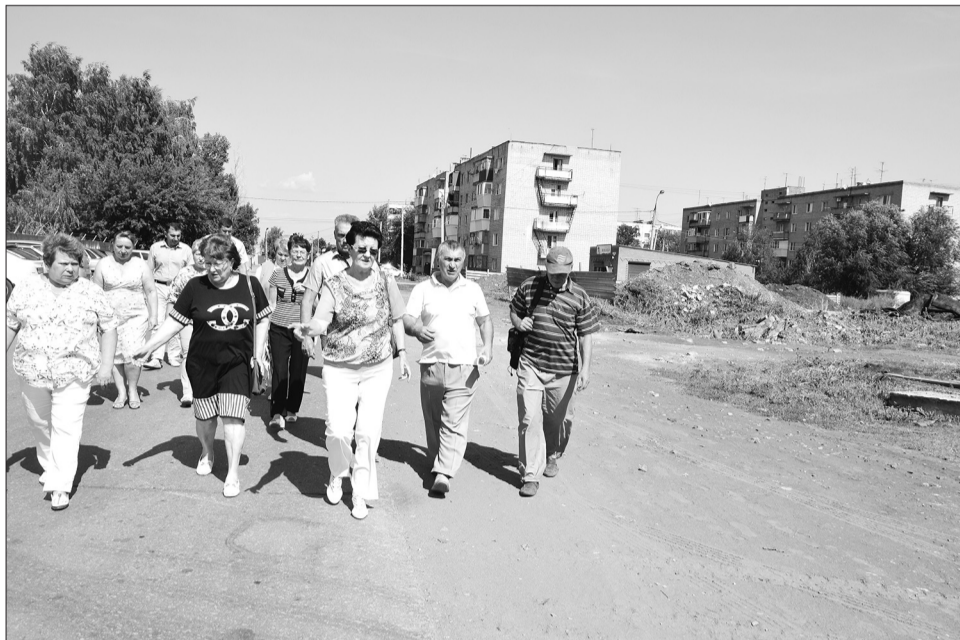
Результаты общественной инспекции обозначили немало проблем в работе блокноте членов Палаты.

Участники выездного заседания подошли к площади на улице Герцена. Вновь бурное обсуждение. Отсутствие тротуара - зимой сюда сгребают снег, он на обочине лежит огромными кучами - пешеходам ни пройти, ни обойти. Следовательно, опять людям ничего не оста-