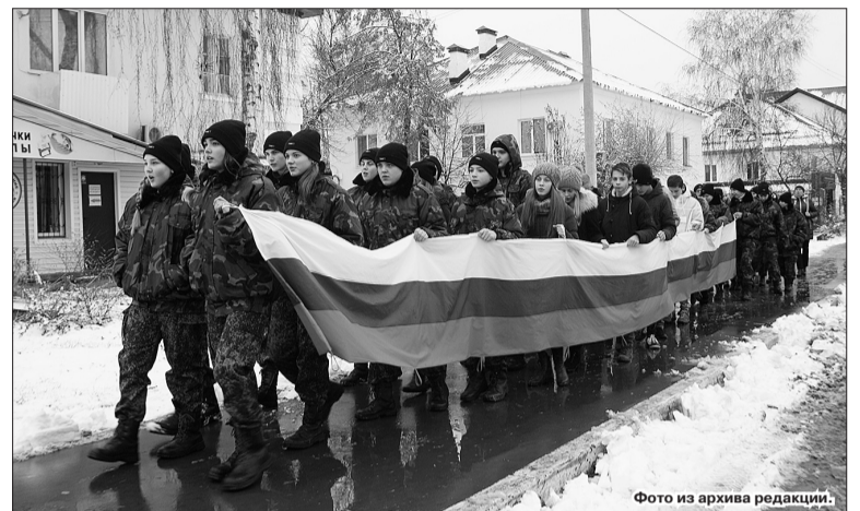
В День народного единства в 2017 году воспитанники военно-патриотических клубов Кинеля пронесли по улицам города полотнище российского триколора.

Освобождение Москвы от польских интервентов стало образцом героизма и сплоченности всего народа вне зависимости от происхождения,