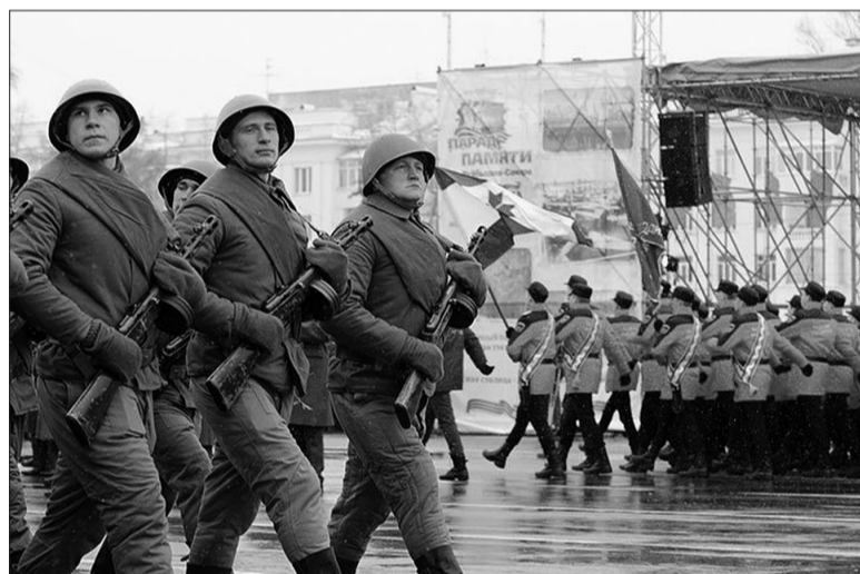
Парад Памяти 2017 в Самаре.

Главное торжество 7 ноября начнется в 10 часов утра со встречи руководства области и города с ветеранами Великой Отечественной войны