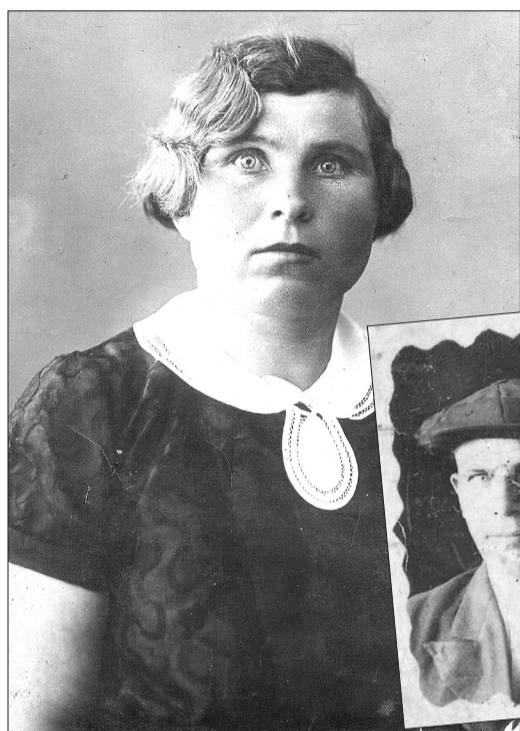
Фотодокументы семьи Павлихиных хранятся в школьном музее.