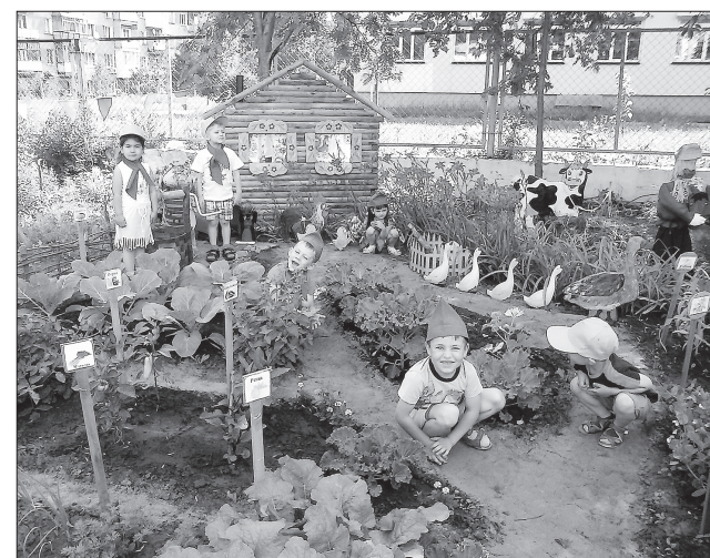
На «Сказочном огороде» все овощи настоящие, полезные и экологически чистые, выращенные воспитанниками.