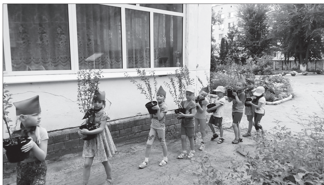
С интересом ребята учатся правильно высаживать растения. В этом процессе получают и экологическое воспитание и трудовой навык.