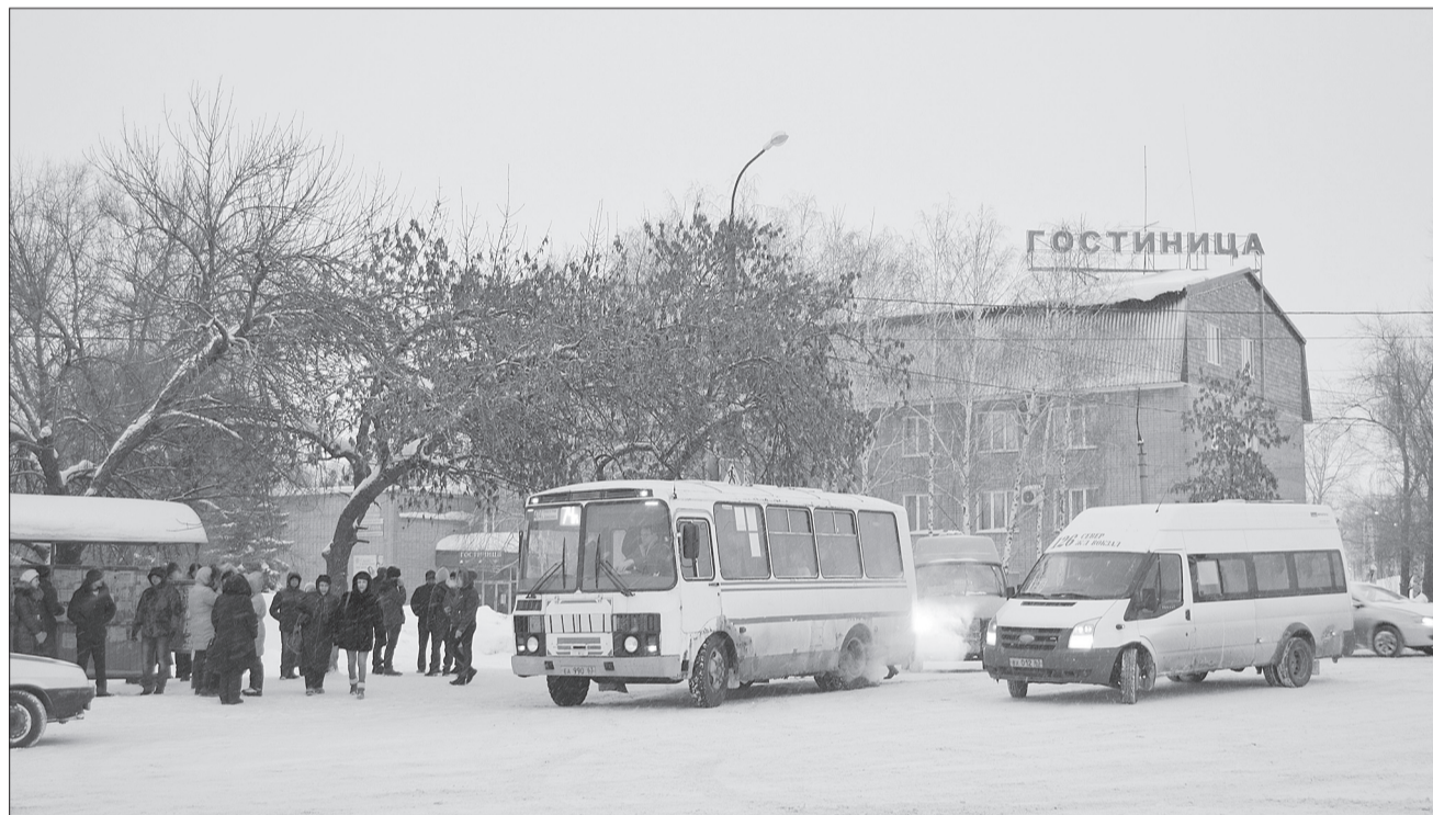
Центральная остановка поселка. Здесь концентрируется наибольшее количество транспорта и пассажиров.

В наступившем году Общественный совет поселка Алексеевка начал работу в обновленном составе