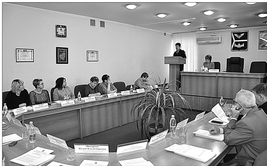
Широкий круг тем рассматривается на Общественном совете при Кинельской Думе. В формируемый план работы на 2019 год войдут вопросы, касающиеся разных сфер жизни городского округа.

Наряду с оперативно-розыскными мероприятиями сотрудники отдела ведут постоянную