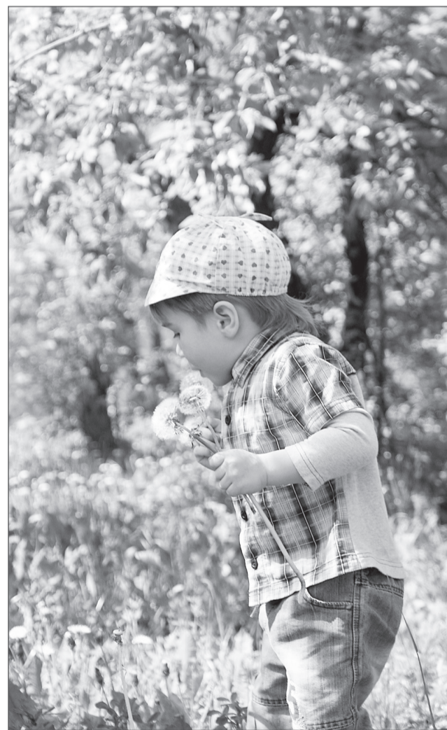
Фотоэтиюд Марии Кошелевой.