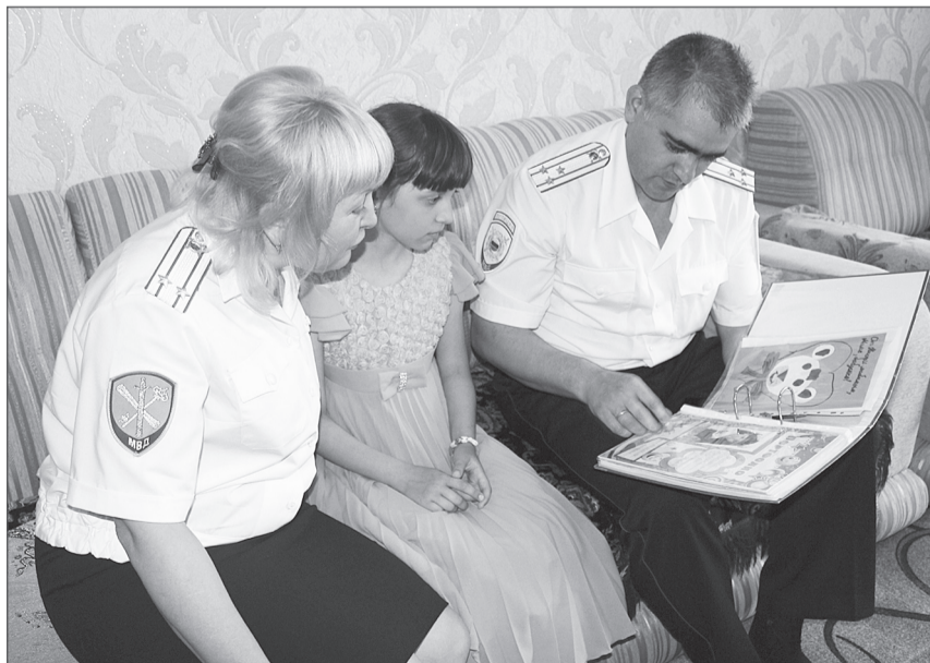
Гостям ребята с удовольствием показали свои творческие работы.

Все дети, которых посетили полицейские, получили сладкие подарки и увлекательные настольные