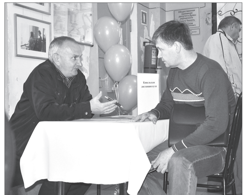
Общение сотрудников кадровых служб и соискателей было активным.

Специалисты Кинельской биржи труда продолжают хорошую практику организации встреч представителей кадровых служб предприятий и учреждений с гражданами, ищущими работу. Ярмарки вакансий, которые в течение года проходят в городском округе, в определенной степени способствуют решению вопросов трудоустройства. В последнее время их направление стало более специализированным.