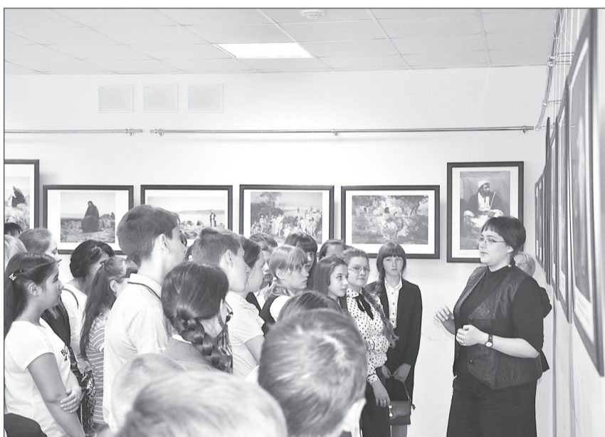
Сотрудничество школы № 10 и музейно-образовательного центра в вопросах эстетического воспитания учащихся стало постоянным.

Музейно-образовательный центр «Школа-музей-культура» стал инициатором проведения целого цикла тематических выставок в образовательных учреждениях Самарской области. Уникальный проект, получивший название «Вечные ценности русской души», является победителем международного открытого грантового конкурса «Православная инициатива-2015» в направлении «Культура». Конкурс проводился под покровительством Святейшего патриарха московского и всея Руси Кирилла.