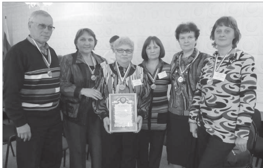
Взрослая команда знатоков заняла третье место в турнире.

Наша «Книголюбы» вышли в финал «Брейн-ринга», но в упорной борьбе чуть-чуть уступили команде студентов. В общем зачете по