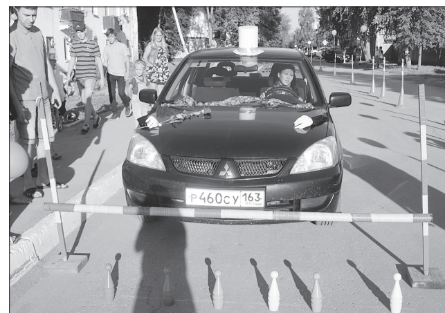
Фигурное вождение - это водительский опыт, точный расчет и смекалка.