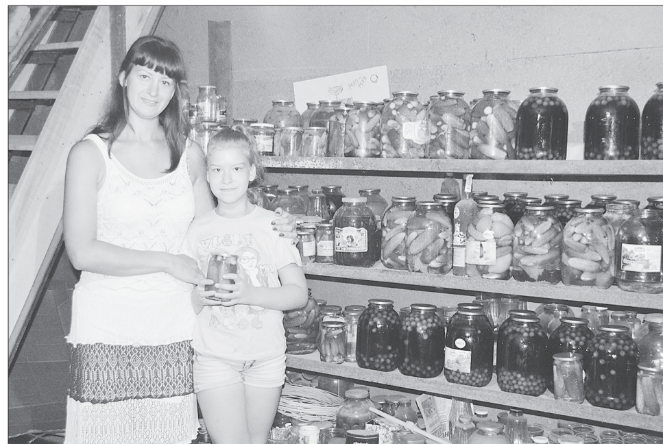
У заботливых хозяек фрукты и овощи на столе круглый год.