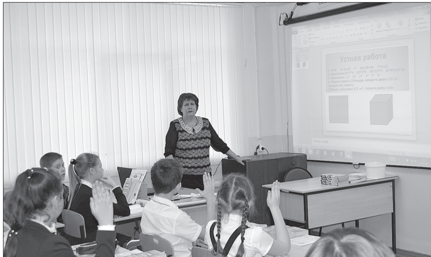
В школе № 2 проводится системная работа по преемственности всех учебных звеньев.

В рамках внутришкольной готовности к государственной итоговой аттестации администрация образовательного учреждения