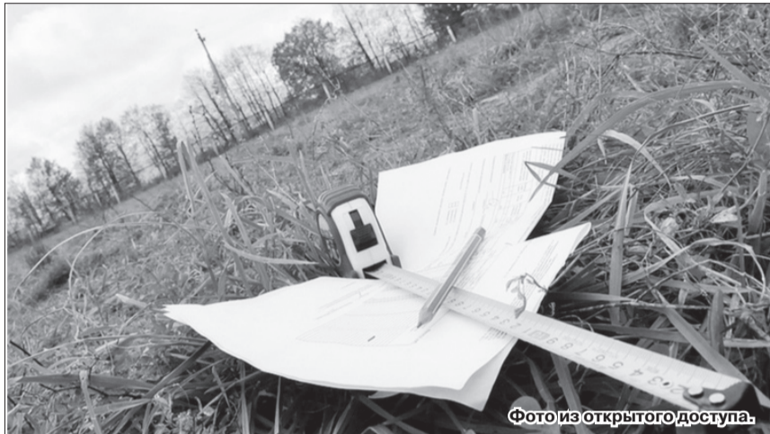
В последние годы технические требования к кадастровому учету земли значительно изменились.

Обязательным условием оформления межевого плана является также согласование с соседями, а они порой не дают согласия: мол, мой забор всегда тут стоял и передвигать его не позволю. Впрочем, следуя практике, это проблема второго или даже третьего порядка. Главная сложность заключается в том, что нередко