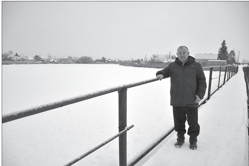
Зимой вокруг моста все белоснежно, а летом от озера идет прохлада и здесь по-своему красивый природный уголок.

ПРИХОДИТЕ по адресу редакции: ул. Маяковского, 90 «а» (здание регистрационной палаты). ПИШИТЕ на электронный адрес: informcentr1@yandex.ru