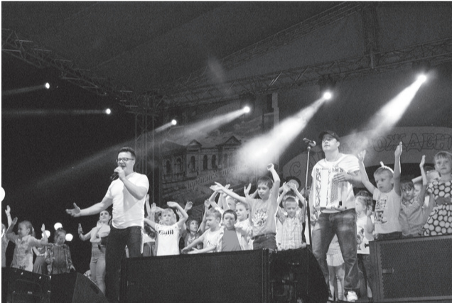
Группа «Баян Микс» полюбилась кинельцам. Коллектив стал постоянным гостем праздничной программы Дня города. Дважды «Баян Микс» выступал в Кинеле и всегда с неизменным успехом у благодарной публики.

15 марта в Самарском академическом театре оперы и балета состоится гала-концерт и награждение лауреатов фестиваля.