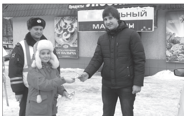
Юные помощники ГИБДД - учащиеся образовательных учреждений - всегда готовы провести профилактические акции, чтобы напомнить водителям о правильном поведении на дороге.

Парни и девушки, награждающие аплодисментами водителей, которые вежливо пропускают пешеходов, инспекторы ГИБДД в костюмах Дедов Морозов, раздающие небольшие призы тем, кто использует ремни безопасности и специальные детские автомобильные