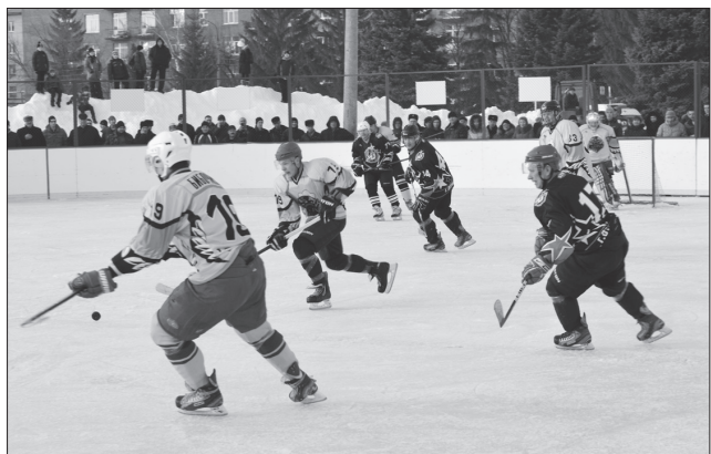
Спортивные площадки зовут. Отдыхаем активно!

22 и 23 февраля на универсальной площадке «Старт-Арена» в Детском парке состоятся финалы городского первенства по хоккею. В понедельник на лед выходят детские команды: на 10 часов намечен матч за третье место, в 12 - игра за звание победителя турнира. Взрослые «скрестят» клюшки в праздничный день 23 февраля: в 10 часов - встреча, которая назовет третьего призера, в 12 часов - матч за первое место.