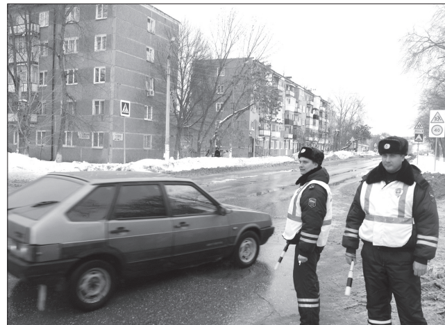
Инспекторы дорожно-постовой службы отделения ГИБДД проводят рейды на городских улицах в зоне интенсивного движения транспорта.

кресла, «живые инсталляции», предупреждающие водителей о необходимости соблюдать скоростной режим, дети, вручающие письма-обращения автолюбителям. Все это, может, на первый взгляд, странные акции на самом деле необходимы, потому что информация лучше всего запоминается на фоне положительных эмоций.