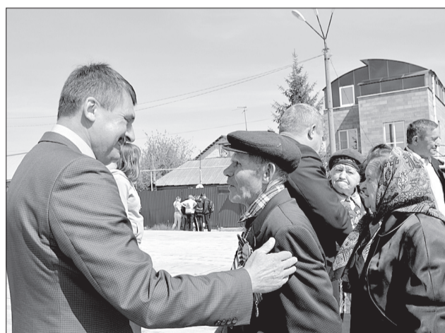
С ветеранами тепло пообщался председатель Федерации легкой атлетики Александр Иосифович Казмерчук.