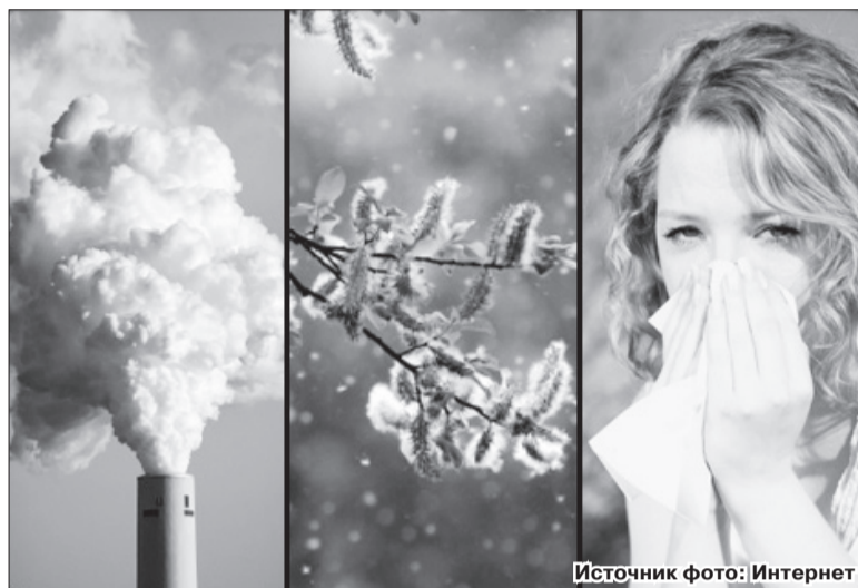
Страдающим бронхиальной астмой нужно точно знать аллерген, который вызывает плохое самочувствие.

расположенностью, в чьей семье были родственники, страдающие аллергией;