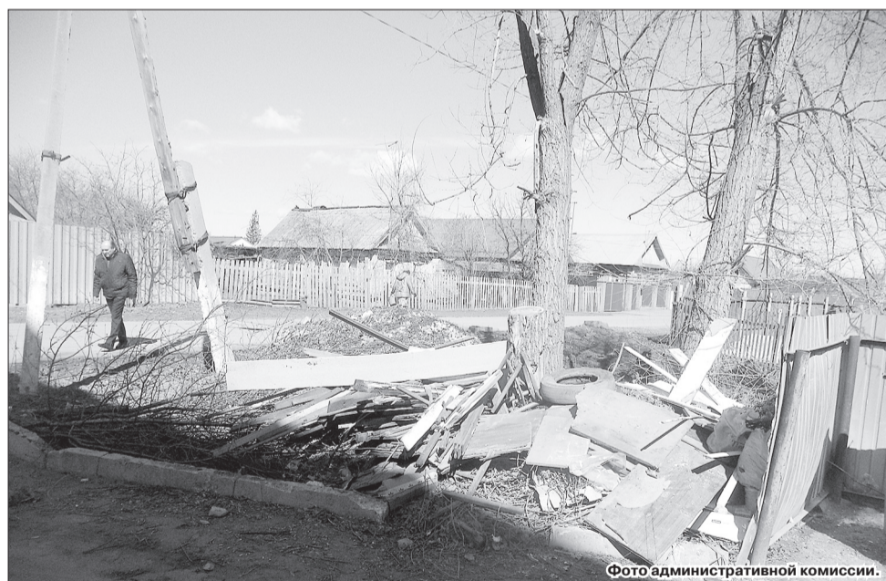
Острой остается проблема складирования крупногабаритного мусора у контейнерных площадок, не предназначенных для этих целей.

важно, ведь это означает, что он готов к диалогу, благодаря чему будут учтены все обстоятельства и вынесено наиболее оптимальное и верное решение.