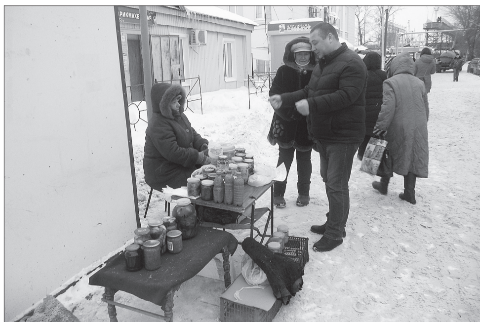
Административная комиссия регулярно проводит рейды по предупреждению нарушений правил розничной торговли на территории общего пользования.

Административная комиссия при администрации городского округа Кинель начала свою работу с декабря 2006 года. А с сентября 2011-го функционирует как структурное подразделение отдела административного, экологического и муниципального контроля администрации. Основная цель деятельности комиссии - исполнение функций по рассмотрению дел об административных правонарушениях в области общественного порядка, благоустройства и содержания территорий. Работа комиссии связана с исполнением и других полномочий, которыми муниципальный контрольный орган наделен в соответствии с Законом № 115-ГД «Об административных правонарушениях на территории Самарской области».