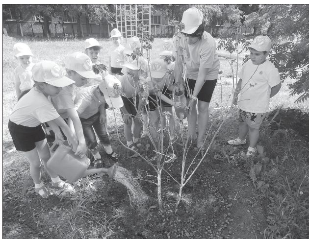
Воспитанники ухаживают за зелеными уголками на территории детского сада.