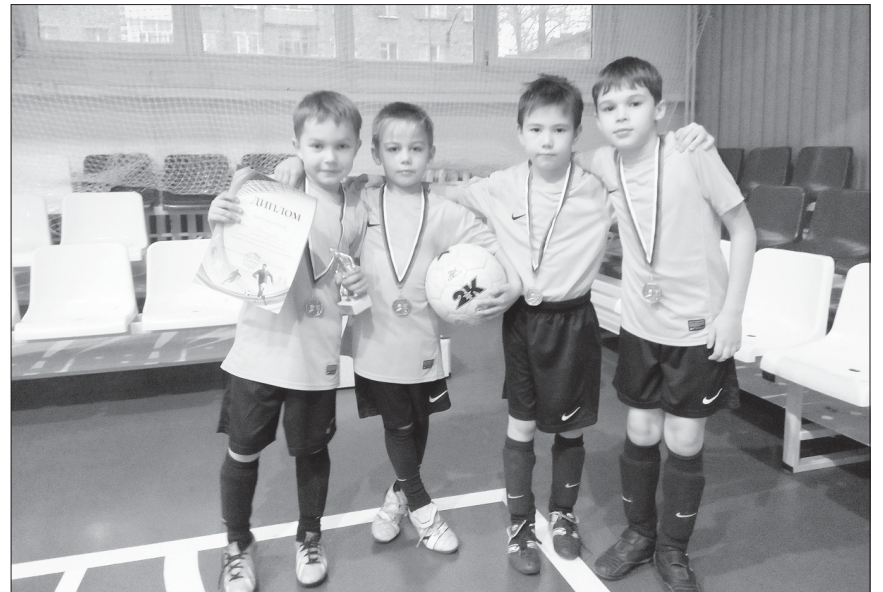
Подопечные тренера подают большие надежды.

Полученные знания молодой тренер передает своим юным воспитанникам. И результаты не заставляют себя ждать. Команда успела заявить о себе за пределами нашего городского округа.