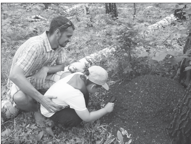
Познавательной была экскурсия в «Муравельный лес».