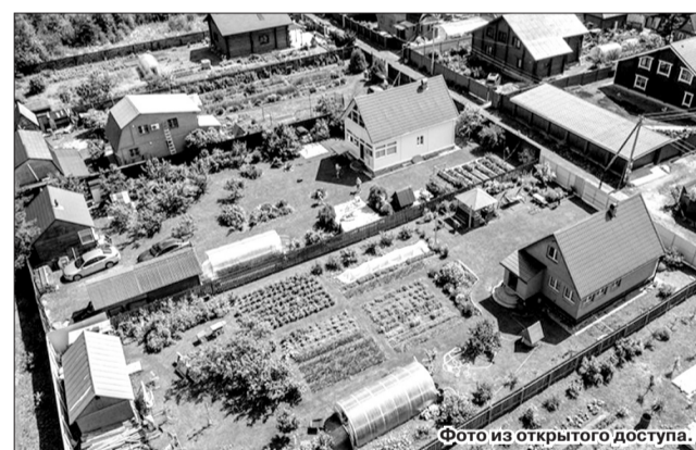
Привычное еще с далеких советских времен слово «дача» с нового года уйдет из официальной терминологии служб, занимающихся кадастровой и градостроительной деятельностью.

Для легализации возведенного строения владельцу земельного участка надо будет заполнить декларацию об объекте недвижимости по форме, установленной Минэкономразвития России, а затем обратиться к кадастровому инженеру для составления технического плана объекта. Техплан, а также заявление собственника потребуются впоследствии для осуществления государственного кадастрового учета и регистрации прав на данную недвижимость.