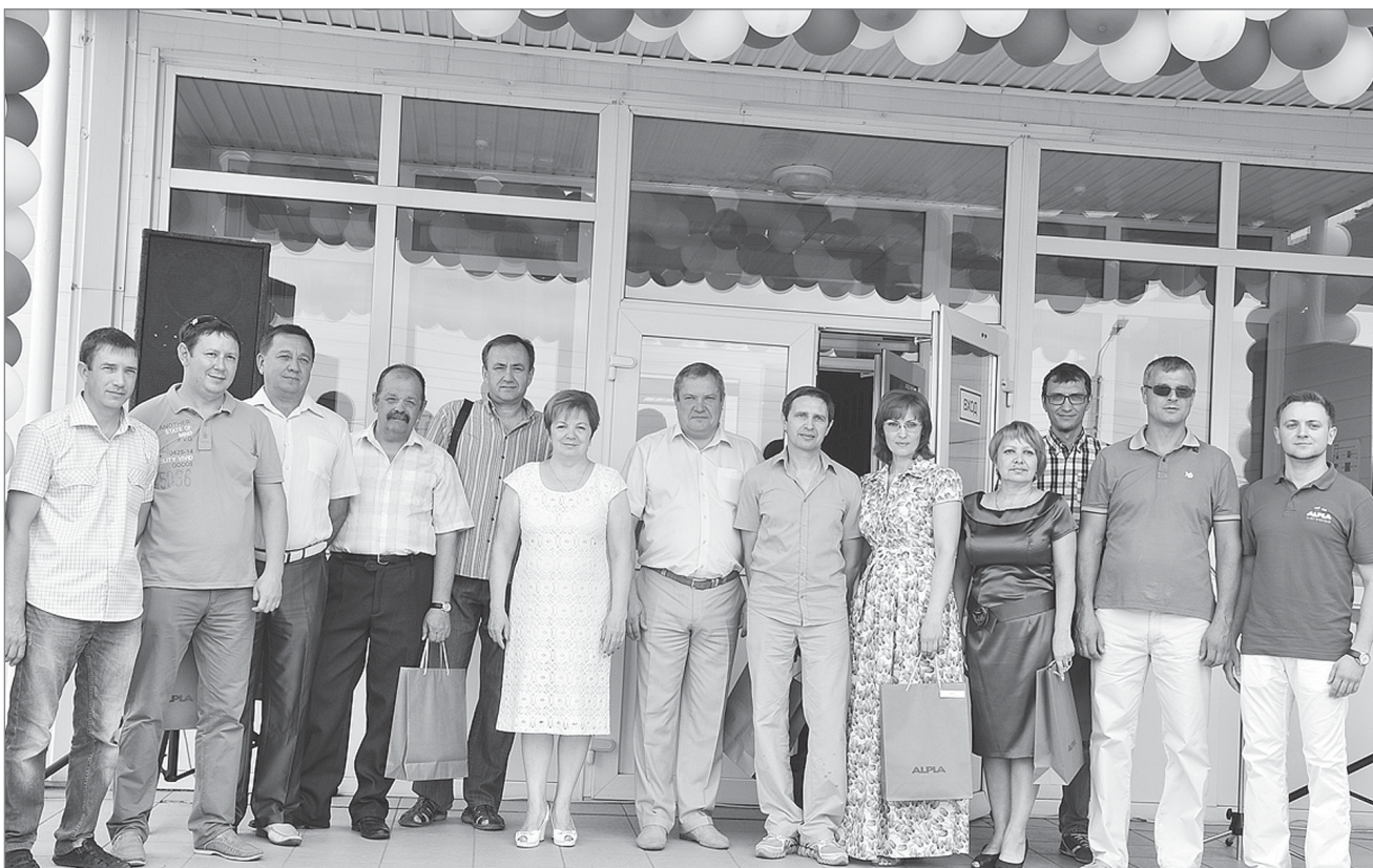
Руководители городского округа с сотрудниками, которые были поощрены в честь юбилея завода.

КИНЕЛЬСКОЕ СОВМЕСТНОЕ АВСТРИЙСКО-РОССИЙСКОЕ ПРЕДПРИЯТИЕ ОТМЕТИЛО СВОЕ ДЕСЯТИЛЕТИЕ