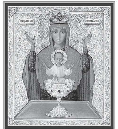
Икона «Неупиваемая чаша».

Интересна и разнообразна культурно-просветительская программа. Это беседы, круглые столы и открытые лекции-дискуссии, встречи с православными писателями и журналистами, видеолекции, выступления православных исполнителей.