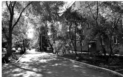
После проведенных работ зеленый двор дома № 82 «а» по ул. Маяковского стал уютным.

Мероприятия по благоустройству определены в рамках муниципальной программы «Модернизация и развитие автомобильных дорог общего пользования местного значения». В этом году в программу вошли территории домов № 81 «а» и № 82 «а» по улице Маяковского, № 39 по улице Южная, а также придомовое пространство дома № 5 по улице Заводская.