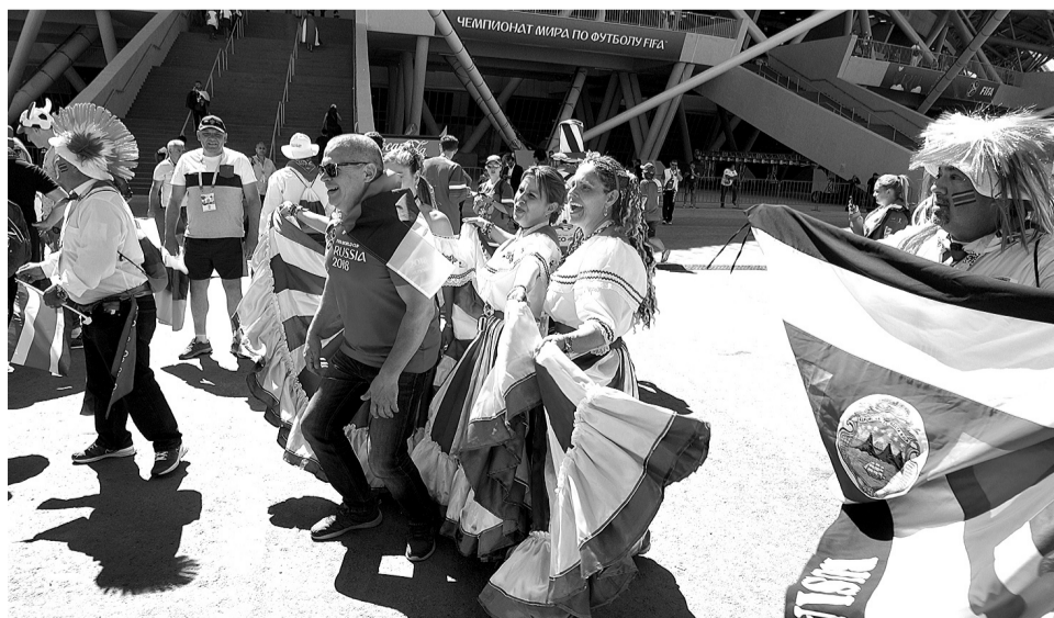
Веселые, открытые, музыкальные: костариканцы «зажигали» на «Самара Арена».