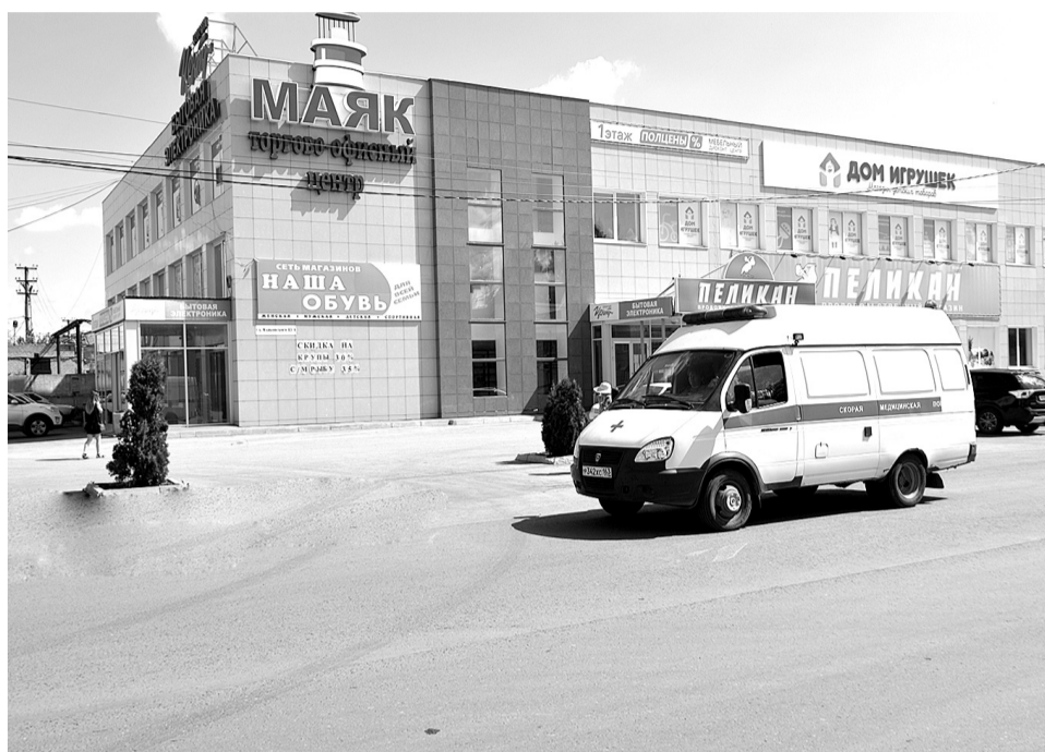
Перевод Станции скорой медицинской помощи из Кинеля в вышестоящую структуру пока не решил всех острых вопросов в деятельности этого важного и необходимого для населения медицинского подразделения.

деление полномочий и ведомственной принадлежности - Станция скорой помощи теперь не входит в структуру Кинельской больницы, а переведена в подчинение Самарской областной станции скорой медицинской помощи.