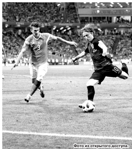
Фото из открытого доступа.