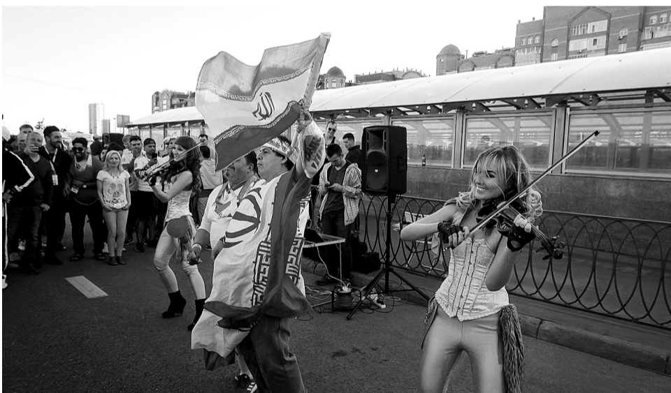
Девушки-скрипачки в Казани ни на минуту не оставались без танцевального сопровождения болельщиков.