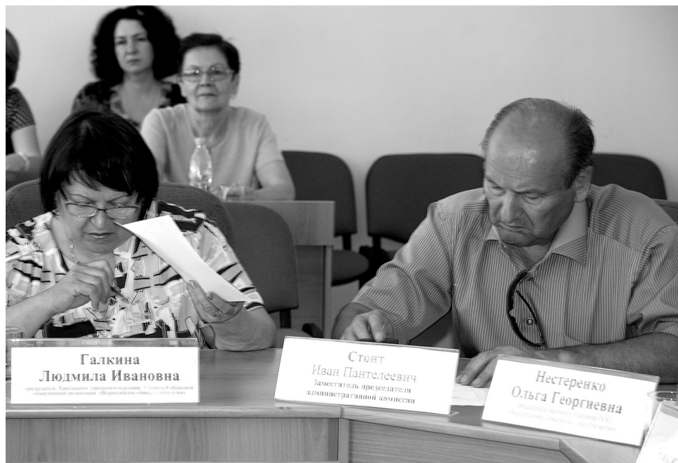
Общественный совет при Кинельской Думе принял решение оставить вопрос о «скорой» на контроле и вернуться к его рассмотрению в ближайшее время.