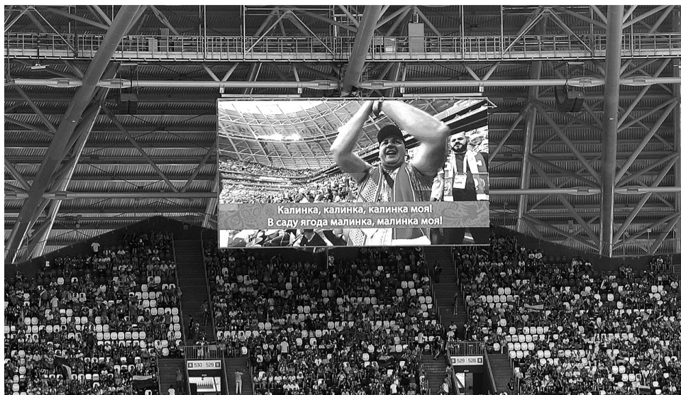
Караоке перед началом матча. Многотысячный хор болельщиков исполнил «Калинку», понятную на всех языках.