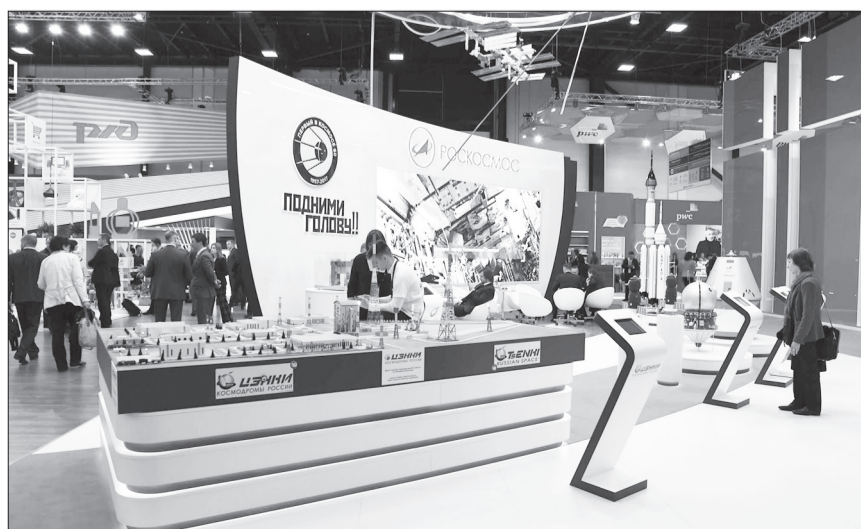
На выставочных площадках форума были представлены передовые технологии российской экономики.

По материалам издания «Российская газета-Неделя».