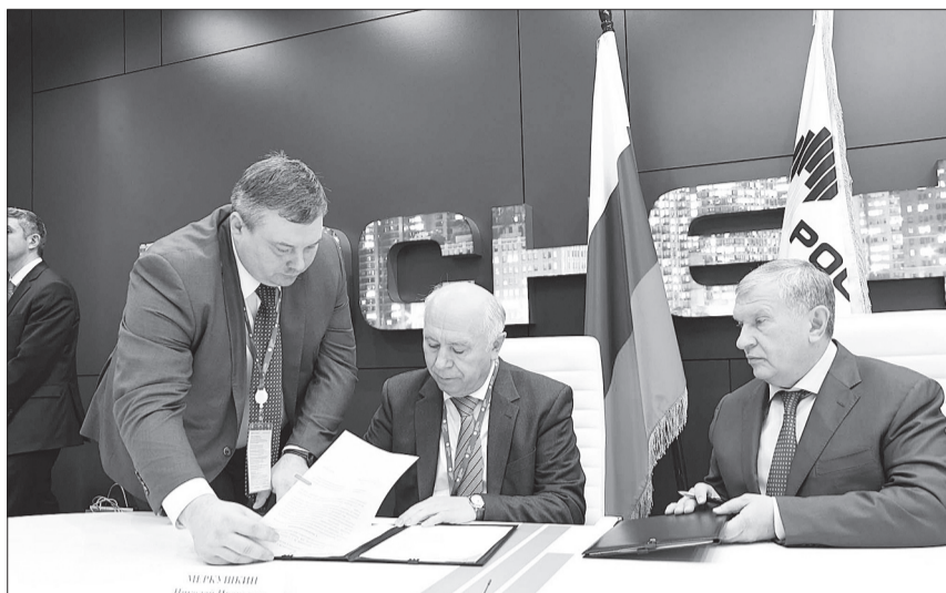
«Роснефть» продолжит реализацию инвестиционной программы в Самарской области.

го воссоединения Крымского полуострова с Россией Самарская область одной из первых среди регионов РФ приняла программу о сотрудничестве и помощи Сакскому району республики. Совместная работа началась уже в 2014 году, сразу после того, как Крым вошел в состав России.