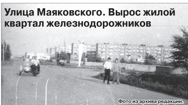
Улица Маяковского. Вырос жилой квартал железнодорожников