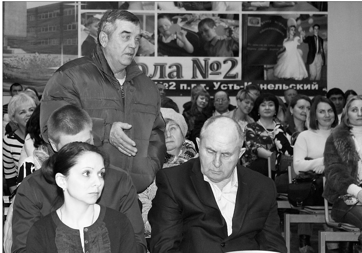
Встречи в поселке всегда проходят заинтересованно со стороны жителей.

Построен тротуар на улице Бульварная (в границах от Шоссейной до Селекционной, общей площадью 630 квадрат-