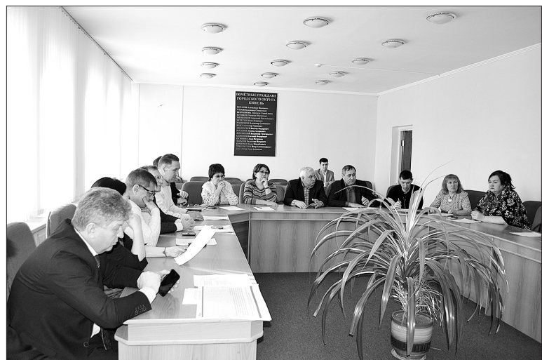
Общественное внимание - одно из главных условий в реализации приоритетного проекта на местах.

Продолжает активную работу общественная комиссия, созданная в городском округе в целях обеспечения реализации муниципальной программы «Формирование современной городской среды». Сейчас в муниципалитете идет подготовительный и организационный период перед началом следующего этапа благоустройства в рамках приоритетного федерального проекта, стартовавшего в 2017 году по всей стране.