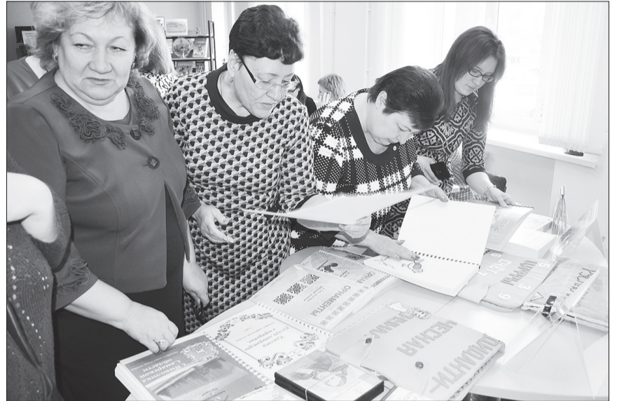
Кинельских библиотекарей заинтересовала выставка изданий, которые предназначены для слабовидящих людей.

Например, четырехтомный роман Льва Толстого «Война и мир», напечатанный рельефно-точечным шрифтом Брайля, становится изданием, занимающим несколько десятков томов. Между тем, такие книги востребованы у читателей разных поколений - в Самаре есть специальный центр, где люди с ограничениями по зрению могут освоить азбуку Брайля.