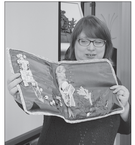
В руках библиотекаря тактильная книга для незрячих детей.

Спектр тем, которые обсуждали коллеги на семинаре, был достаточно широким: участники диалога поговорили, как использовать ре-