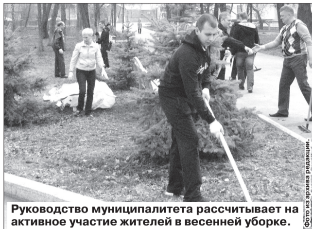
Руководство муниципалитета рассчитывает на активное участие жителей в весенней уборке.

На общегородской субботник выходим 22 апреля .