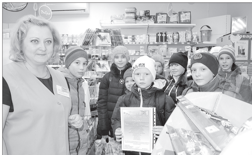
Экологам школы № 2 вручили благодарность за проведенную работу.

На открытом воздухе под дождем и снегом оболочка батарейки быстро разлагается, а ее начинка опасна для окружающей среды. Внутри батарейки находятся ядовитые вещества - тяжелые металлы. Свинец - вызывает заболевания мозга, нервные расстройства. Кадмий - накапливается в печени, почках, костях и щитовидной железе. Может способствовать развитию рака. Ртуть влияет на мозг, нервную систему, почки и печень.