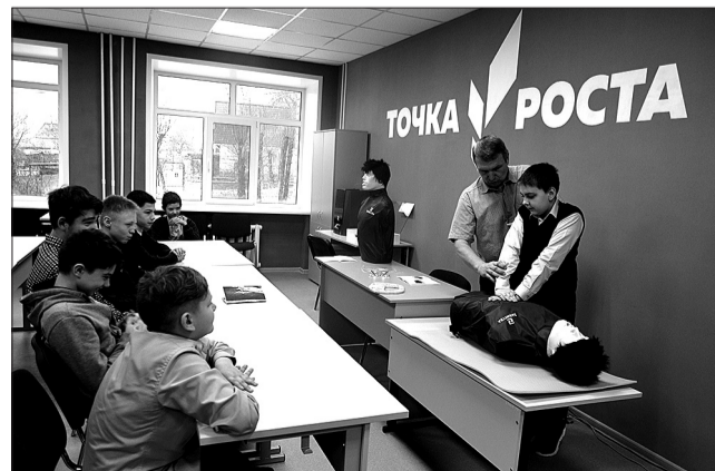
Каждое из предложенных занятий на открытом уроке вызвало повышенный интерес школьников.