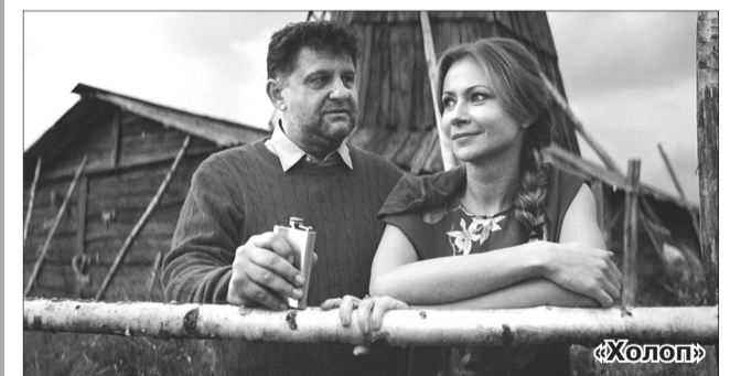
Фото из открытого доступа.