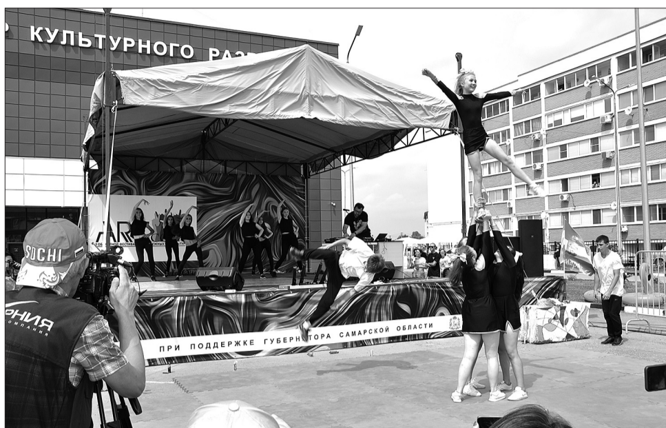
Акробатические фигуры и элементы паркура сопровождали танцевальной поддержкой на церемонии открытия фестиваля.