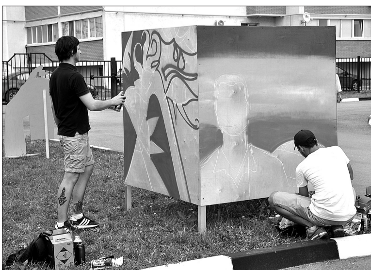
От карандашного наброска до объемного изображения. Конкурсные работы граффитистов в этот раз послужили дополнительным красочным оформлением территории фестиваля.

Фестиваль набирал обороты. Никто не обращал внимания на сгущающиеся тучи и темнеющее небо. Мероприятие приближалось к своему экватору, на главную сцену вышел коллектив танцевальной студии «Beat Move». И в один миг на творческое пространство обрушилась природная стихия. Сильный дождь загнал зрителей и участников фестиваля в