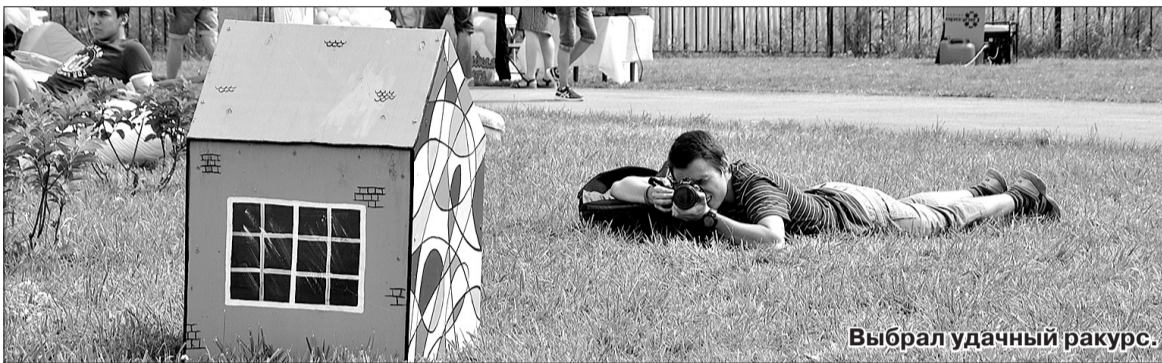
Выбрал удачный ракурс.

здание Центра. Вода моментально залила конкурсные и игровые площадки. Пока организаторы и пришедшие им на помощь волонтеры разбирали аппаратуру и заносили реквизит под крышу, девушки из танцевальной студии «Beat Move» устроили танцы прямо под дождем под ликующие крики зрителей. Позже в сети их назвали «девушки, вызвавшие дождь».