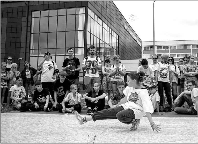
На площадке исполнения уличных танцев можно было не только увидеть выступления, но и поучаствовать самим.