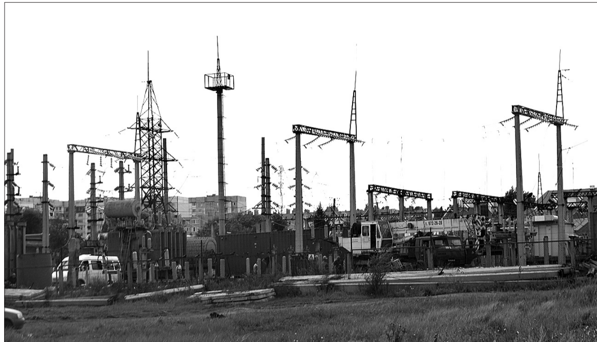
Техническое переоснащение подстанции в поселке Алексеевка полностью завершится в 2019 году.

Для того чтобы прояснить ситуацию и выработать оптимальную схему взаимодействия всех ответственных служб, к разговору пригласили представителей обслуживающих организаций и поставщиков электроэнергии - «МРСК Волги», «Самарской сетевой компании» и «Самараэнерго». Вопросы сетевикам могли задать жители поселка, старшие многоквартирных домов и председатели уличных комитетов, депутаты Кинельской Думы, представители Общественной палаты городского округа и Общественного совета поселка Алексеевка.