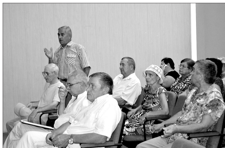
Вопросы к руководству предприятий, обеспечивающих электроснабжение Алексеевки, касались и причин аварии, и последующих действий по ее ликвидации и модернизации подстанции.