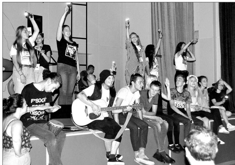
Под шум июльского дождя не переставала звучать музыка. Участники играли на гитаре и ударных инструментах. Осветили творческую атмосферу на время отключения из-за непогоды центрального электричества фонарики мобильных телефонов.