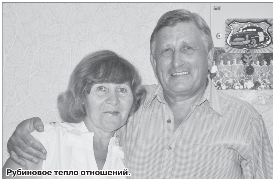
Рубиновое тепло отношений.

«Все счастливые семьи похожи друг на друга», - сказал классик. Однако, у каждой пары своя история взаимоотношений, в которых супруги сберегли уважение и доверие друг к другу.