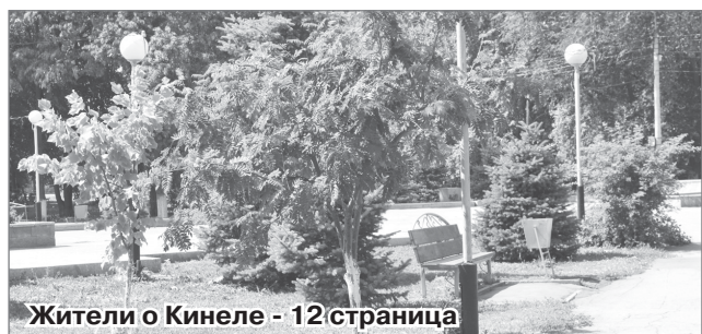
Жители о Кинеле - 12 страница

В Кинеле немало интересных мест, у каждой улицы своя история, некоторые из них связаны с железной дорогой, где трудятся многие жители нашего города. Сегодня в Кинеле многое меняется, он получает второе дыхание. И так хочется, чтобы кинельцы продолжали хранить свои культурные особенности и традиции.