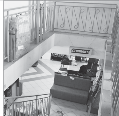
Вход в магазин мебели одного из торговых предприятий, обустроенных предпринимателем.

Тема эта сейчас актуальна. В наше время все хотят получить доход легко, прилагая к этому мини-