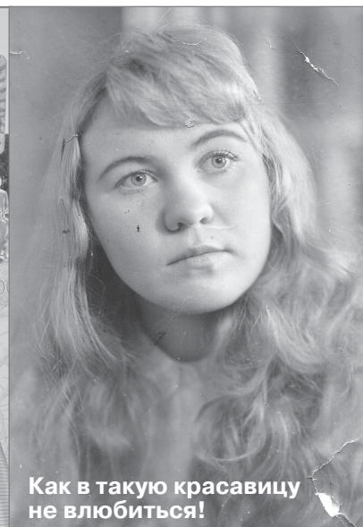
Как в такую красавицу не влюбиться!