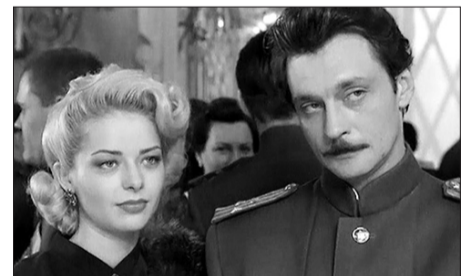
Канал ОТР Т/с «Звезда эпохи»