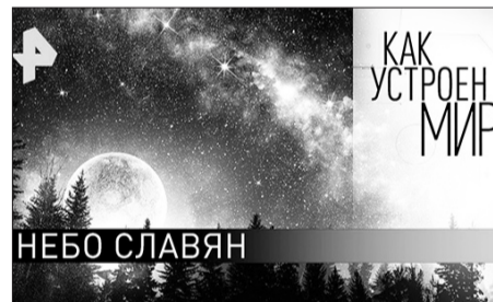
Канал Рен ТВ «Как устроен мир»