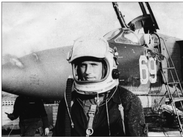
Для полетов в стратосфере используется высотнo-компенсирующий костюм и гермошлем.

Техника постоянно совершенствуется, новые типы сверхзвуковых самолетов не просто отличаются от своих предшественников, - это совсем другие модели. И летчики осваивают новые воздушные машины. В годы