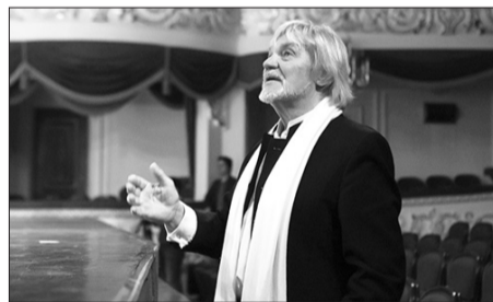
Канал «Россия Культура» Д/ф «Большой балет»