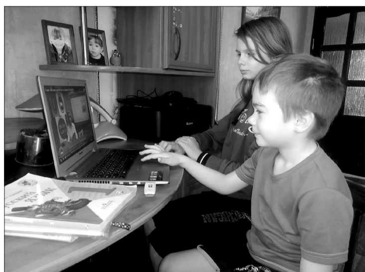
Сейчас в жизни школьников учебники и ученические тетради заменили компьютеры и ноутбуки.

функция «Виртуальный класс» - в домашних условиях можно провести занятия для целой группы обучающихся.