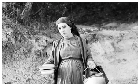
Канал «Россия 1» Т/с «Зулейха открывает глаза»

06.10, 12.45, 16.05 Среда обитания 12+ 06.20, 12.20 Д/ф «Загадочная планета» 12+ 06.45, 09.50, 01.45 Медосмотр 12+ 07.00 Архивариус 12+ 07.05, 00.50 Прав!Да? 12+ 08.00, 19.30 Вспомнить все 12+ 08.10, 09.00, 23.05 Т/с «МУР ЕСТЬ МУР-2» 12+ 10.00 Мультфильм 0+ 10.20 Т/с «ЕВА» 16+ 11.20, 12.05, 18.05 Д/ф «100 чудес света» 12+ 12.00, 13.00, 14.00, 16.00, 18.00, 19.00, 21.00, 23.00 Новости 12+ 13.05, 14.05, 20.00, 21.15 ОТражение 12+ 16.15 Т/с «ЗВЕЗДА ЭПОХИ» 12+ 19.05 Активная среда 12+ 02.00 За дело! 12+ 02.40 Домашние животные с Григорием Маневым 12+ 03.10 Т/с «ДОКТОР ТЫРСА» 16+