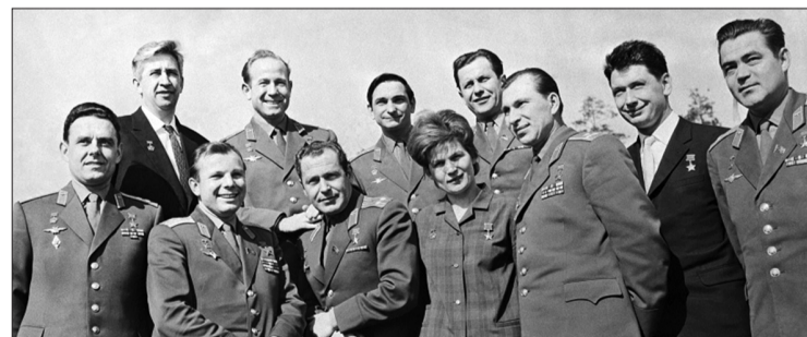
Первые космонавты планеты.

29 ноября 1962 года сдала выпускные экзамены на «отлично». С 1 декабря 1962 года Терешкова - космонавт 1-го отряда 1-го отдела. С 16 июня 1963 года, то есть сразу после полета, она стала инструктором-космонавтом 1-го отряда и была на этой должности до 14 марта 1966 года.