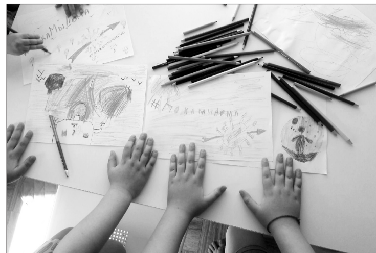
Рисование - самый простой способ занять детей. А объединившись в этом творчестве маленькие и большие члены семьи на его основе могут придумать другие интересные занятия.

Еще один способ с пользой провести время вместе - заняться физическими упражнениями. В сети Интернет можно найти примеры домашних активных игр,