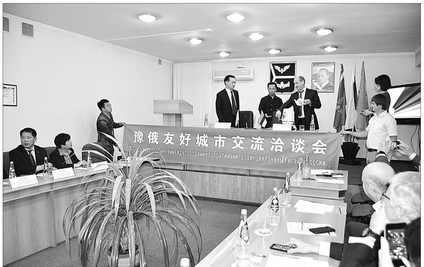
На встрече стороны обменялись памятным подарками и сувенирами.

В ПРОШЕДШУЮ СУББОТУ КИНЕЛЬ ПОСЕТИЛА ДЕЛЕГАЦИЯ ОБЩЕСТВА ДРУЖБЫ С ЗАРУБЕЖНЫМИ СТРАНАМИ ПРОВИНЦИИ ХЭНАНЬ И СЮЙЧАНСКОГО ГОРОДСКОГО ПРАВИТЕЛЬСТВА КИТАЙСКОЙ НАРОДНОЙ РЕСПУБЛИКИ