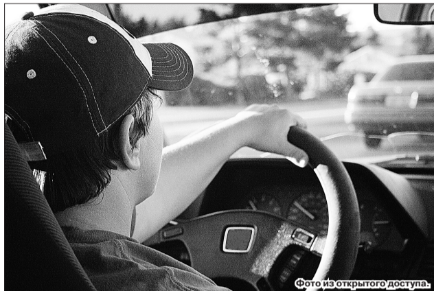
Фото из открытого доступа.

Родители или любые иные уполномоченные законом представители несовершеннолетнего могут быть привлечены к административной ответственности согласно ст. 5.35 ч.1. КоАП. В ней сказано, что за неисполнение или недобросовестное выполнение своих обязательств по воспитанию и содержанию несовершеннолетнего им мо-