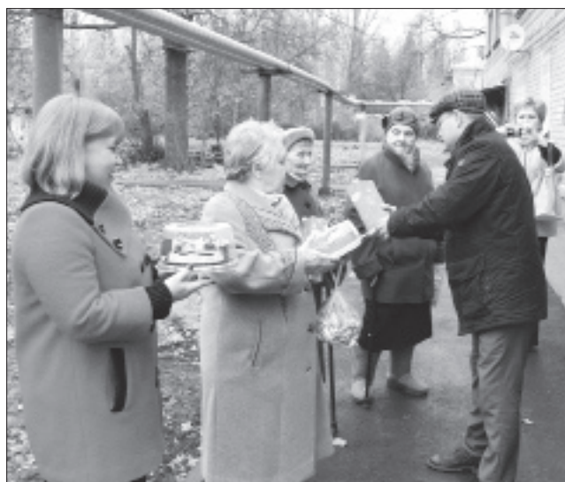
Для организации чаепития сладкие подарки получили жители дома № 3 по улице Испытателей поселка Усть-Кинельский.

Общение прошло в позитивном ключе. Люди с удовлетворением отметили качество проведенных работ, внимание строителей к мнению и пожеланиям жителей в процессе обновления дворов. В знак окончания ремонтных мероприятий и признательности за коллективную работу в каждый благоустроенный двор от подрядной организации были переданы сладкие подарки.