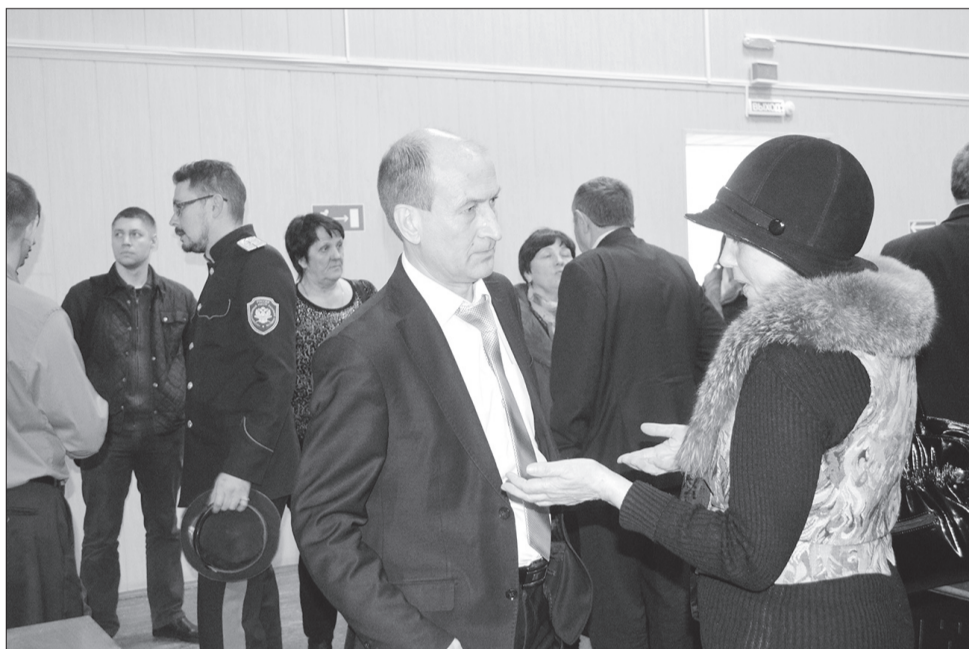
Вопросов от жителей на всех прошедших встречах звучало много. Кинельцы могли обратиться к главе городского округа и после завершения общественного собрания. Этой возможностью воспользовались и алексеевцы.

Решения каких вопросов ждут алексеевцы, жители поселка рассказали на встрече руководителю муниципалитета