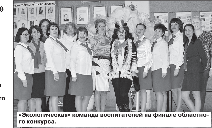
«Экологическая» команда воспитателей на финале областного конкурса.

Под занавес года, в середине декабря, в Самарском институте повышения квалификации работников образования после всех отборочных этапов состоялся финал областного конкурса образовательных организаций Самарской области, внедряющих инновационные образовательные программы дошкольного образования «Детский сад года». В трех номинациях - «Основы безопасности жизнедеятельности», «Трудовое воспитание» и «Экология» за этот титул боролись девять