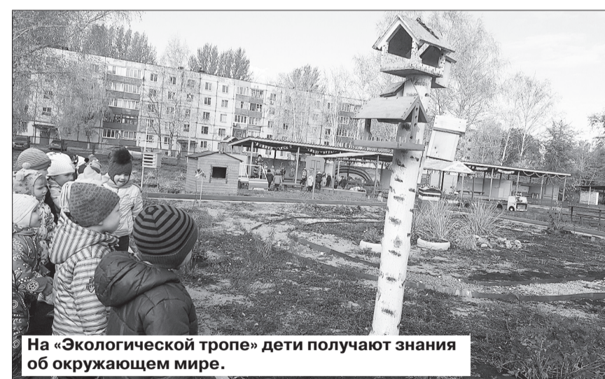
На «Экологической тропе» дети получают знания об окружающем мире.