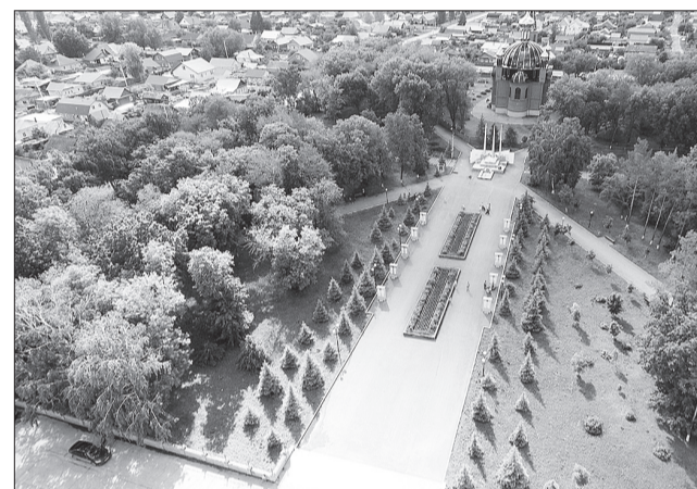
Парк Победы с высоты почти птичьего полета.

В наступившем году работы по созданию сквера в непосредственной близости к площади Мира будут продолжены.