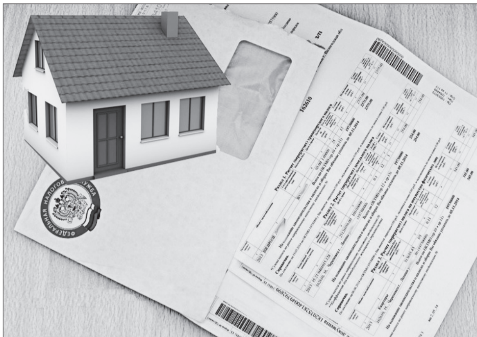
На уровне областных ведомств проводится анализ причин внесения в уведомления ошибочных сведений об имуществе граждан. Индивидуальные случаи обрабатываются в рабочем режиме.

Кроме того, поясняет Л. Н. Замула, в работе Росреестра есть такое понятие - дубли объектов недвижимости. Дело в том, что в 1990-е годы гаражи и дачи вносились в базу данных по рукописным документам, в которых не указывались точные адреса. Например, такой-то гараж находится в городе Кинеле в районе