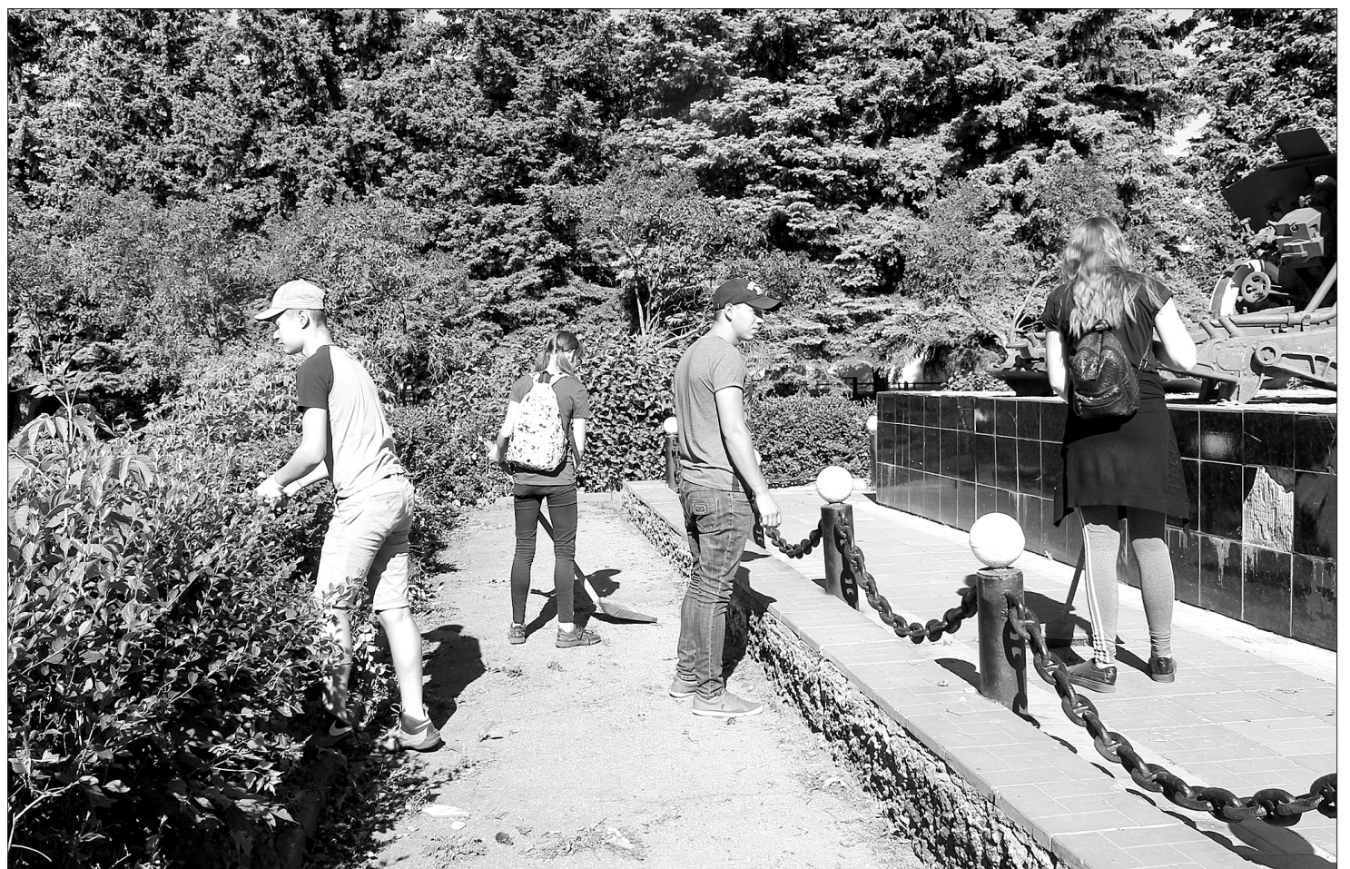
Участники школьной трудовой бригады признаются: теперь они знают, сколько труда требуется, чтобы поддерживать город и родной поселок в порядке.

Предварительная запись по телефону: 8(84663) 2-18-80.