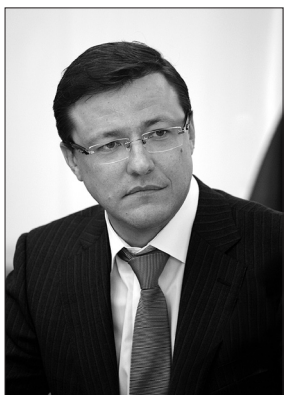
ВРЕМЕННО ИСПОЛНЯЮЩИЙ ОБЯЗАННОСТИ ГУБЕРНАТОРА САМАРСКОЙ ОБЛАСТИ Д. И. АЗАРОВ