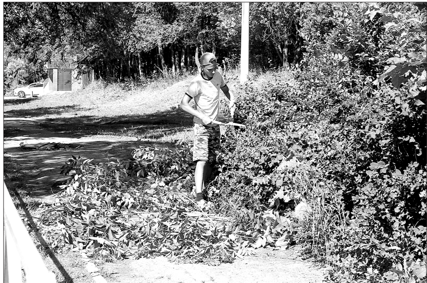
Трудовые задания ребята выполняют с большим старанием.

За время работы прогулов в бригаде учеников не зафиксировано. Ответственно к труду своих детей подходят и родители. К примеру, одни отпросили дочь на запланированную поездку, но с твердым обещанием отработать пропущенное время. В первый рабочий день ре-