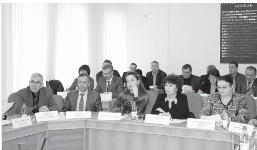
Вопросы о качестве медицинских услуг задавали члены Общественного совета.