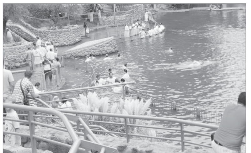
С чувством духовного очищения паломники вступают в воды Иордана.