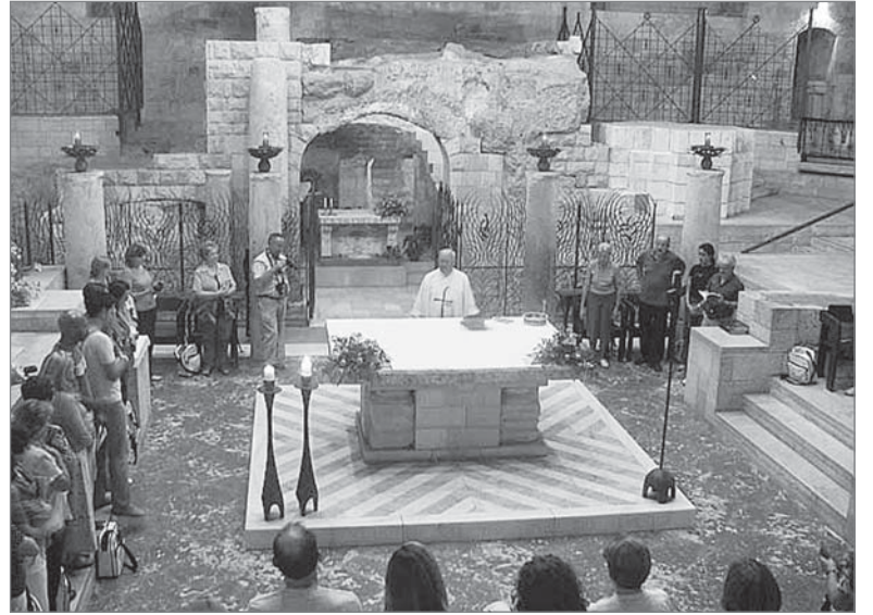
Назарет. Базилика Благовещения - крупнейшая христианская церковь на Ближнем Востоке.