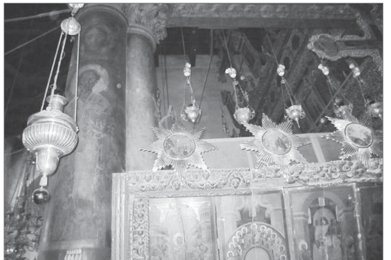
Одно из главных чтимых мест на Святой земле в Вифлееме. Место рождения Христа отмечено серебряной звездой.