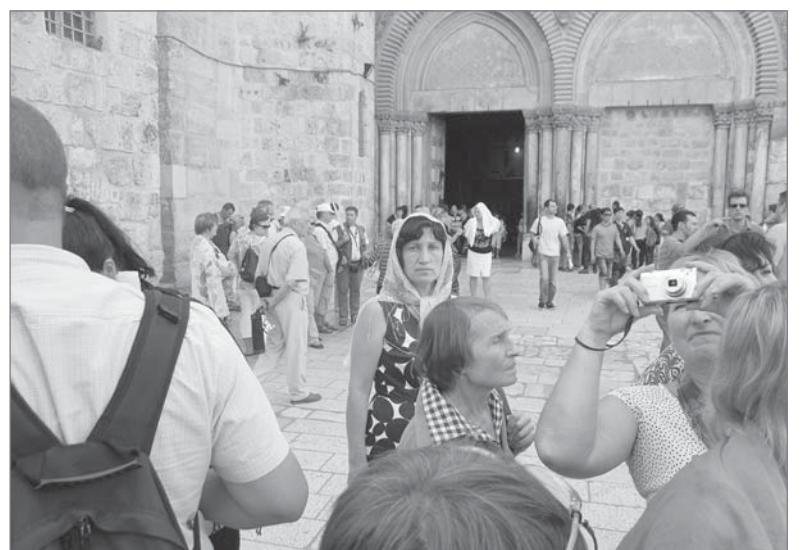
Кажется, что каждый камень, вложенный в строительство Храма гроба Господня, хранит историю Вифлеема.