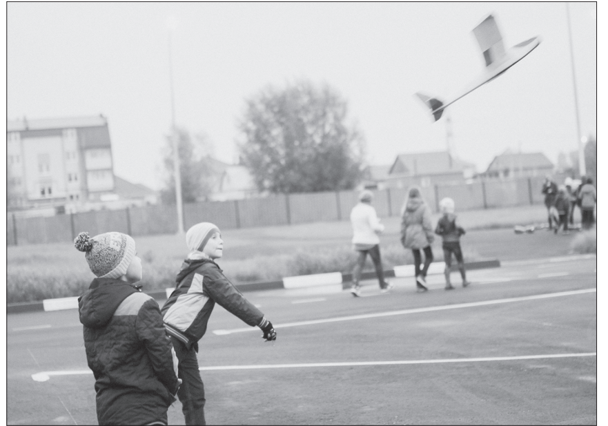
Юных кинельцев привлек урок по авиамоделированию.

Ребята объяснения педагога поняли. Теперь самолетик, выпущенный из их рук, перестали