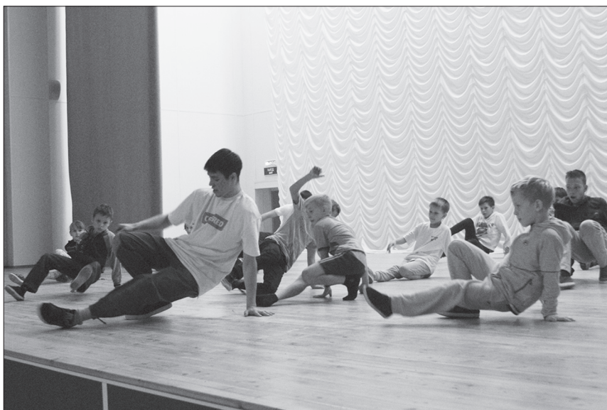
В завершении насыщенной арт-программы показательное выступление брейкинга.