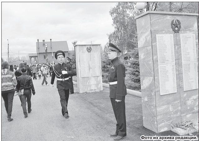
Участники военно-патриотических клубов «Патриот ДОСААФ» и «Вольница» ежегодно 9 мая в городском парке Победы стоят в почетном карауле.

Подводились итоги отборочного этапа на торжественном построении всех команд. Газета расскажет подробнее о прошедшем мероприятии.