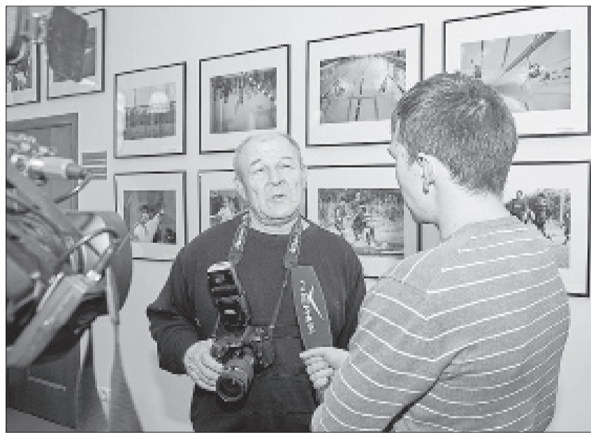
В финальную экспозицию вошло 32 работы девяти авторов.

Фотоработы оценивались по следующим критериям: нестандартное художественное решение, изобретательность и креативность, уровень сложности и глубина раскрытия темы, яркость образов, выразительность.