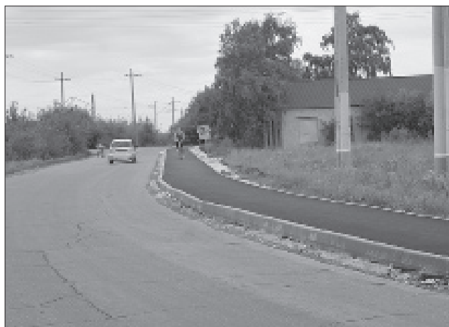
В текущем году проведены значительные работы по ремонту дорог, внутридворовых территорий и обустройству новых тротуаров.