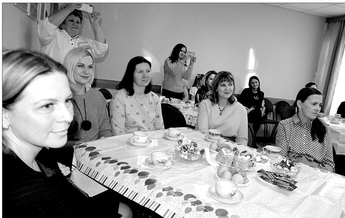
Мама слушала выступление детей с нежностью, глаза их светились теплом и счастьем.