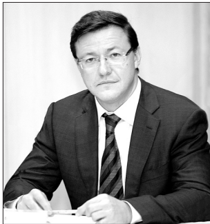
ГУБЕРНАТОР САМАРСКОЙ ОБЛАСТИ Д. И. АЗАРОВ