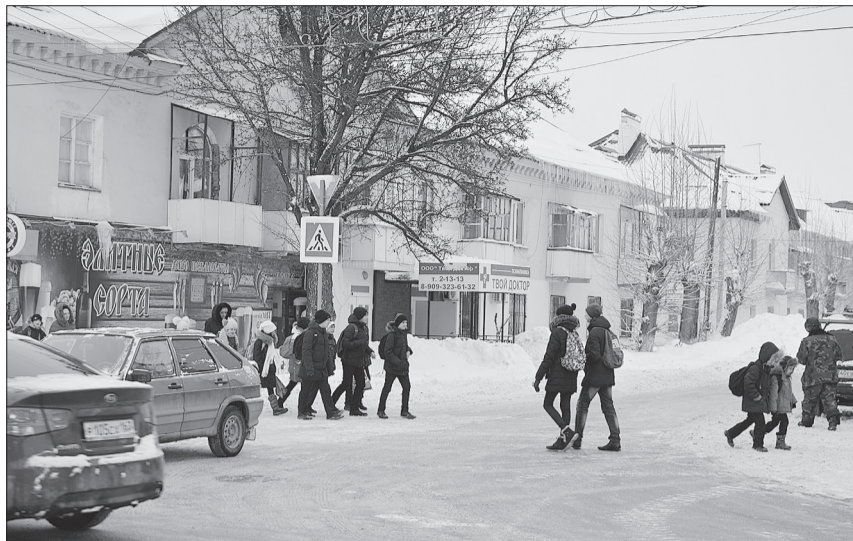
Инспекторы ГИБДД выступают за обязательное применение световозвращающих элементов для школьников.