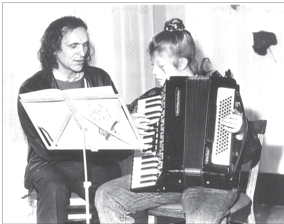
Много лет творчески и талантливо любовь к музыке преподаватель растит в своих воспитанниках.