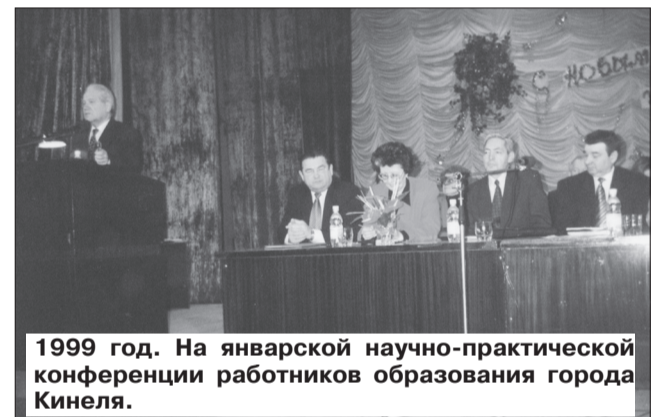
1999 год. На январской научно-практической конференции работников образования города Кинеля.