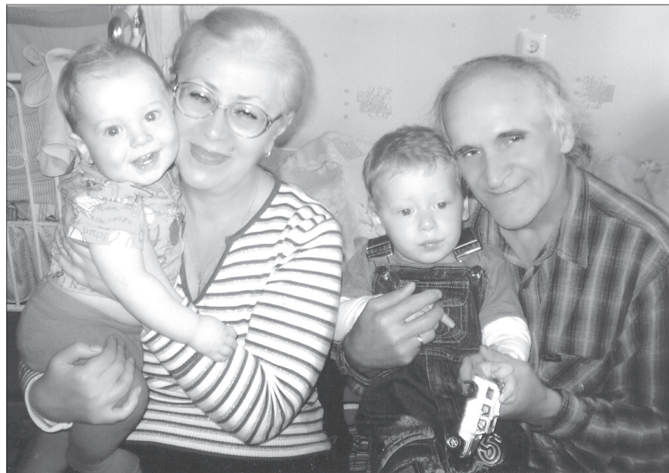
Уютное семейное счастье вместе с теми, кто бесконечно близок, дорог и любим.