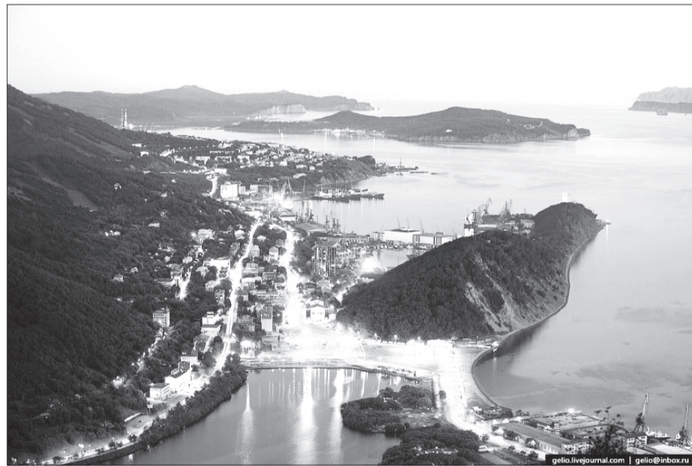
Авачинская бухта в вечернем освещении.

называлось «Адольф Гитлер» (по другой версии - «Великая Германия») и якобы по этой причине немцы поклялись утопить его при первом удобном случае. Появление последней легенды возникло на почве того, что в октябре 1955 года (за полтора года до появления «Советского Союза» во Владивостоке) на рейде Севастополя взорвался и затонул, унеся с собой в пучину более 600 человек, линкор «Новороссийск». Он также был получен по репарации, прежде входил в итальянский ВМФ и назывался «Джулио Чезаре». Поговаривали, что «Новороссийск» взорвали итальянские боевые пловцы. В то время они считались лучшими в мире. А потому многие дальневосточники были убеждены, что «Советский Союз» специально «спрятали» на самый дальний бассейн (Дальневосточный). После того, как «Советский Союз»