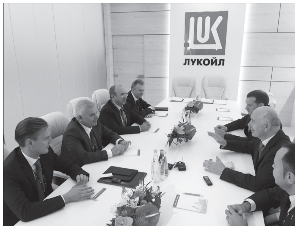
Новые шаги в совместной работе были определены по результатам встречи делегации Самарской области и руководства компании «Лукойл».

гация Самарской области во главе с губернатором Николаем Ивановичем Меркушкиным приняла участие в работе Петербургского международного экономического форума (ПМЭФ)