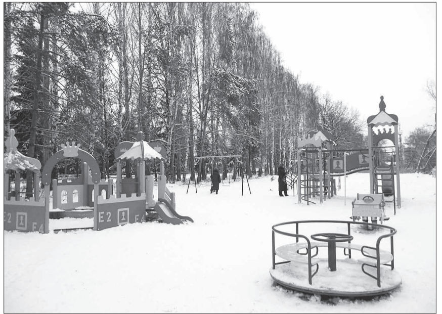
С наступлением тепла работы по благоустройству спортивно-игрового городка будут продолжены.

Понятно, что даже самая продвинутая молодежь на одном своем энтузиазме такой объем работ