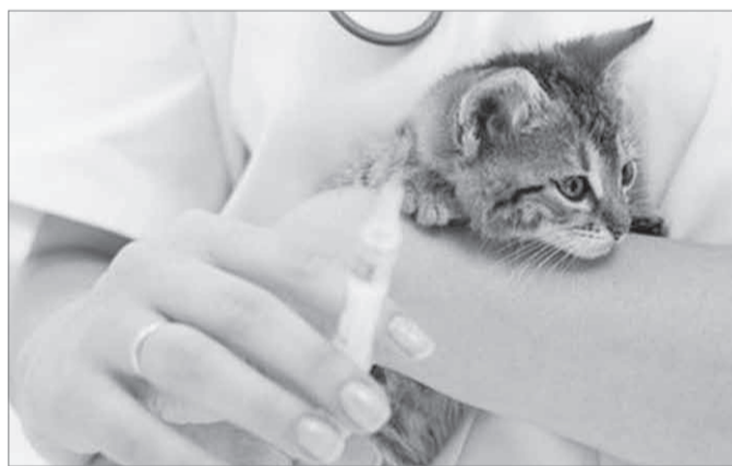
О здоровье домашних питомцев нужно заботиться и проводить предохранительные прививки, чтобы уберечь животное от опасной болезни.

В отдельных случаях, по разрешению ветеринарного лечебного учреждения, животное, покусавшее людей или животных, может быть оставлено у владельца. Делается это на основе письменного обязательства владельца содержать животное в изолированном помещении в течение