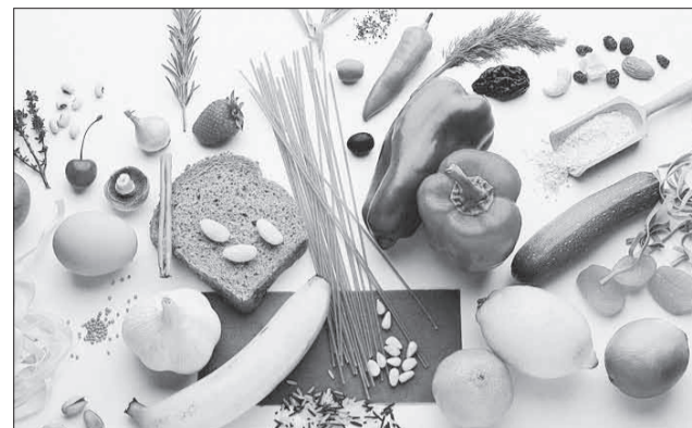
При бронхиальной астме очень внимательно нужно относиться к питанию.

Нужно несколько ограничить и углеводы, вводя в рацион более легкоусвояемые из них, то есть употреблять больше овощей, фруктов, ягод, пить соки.