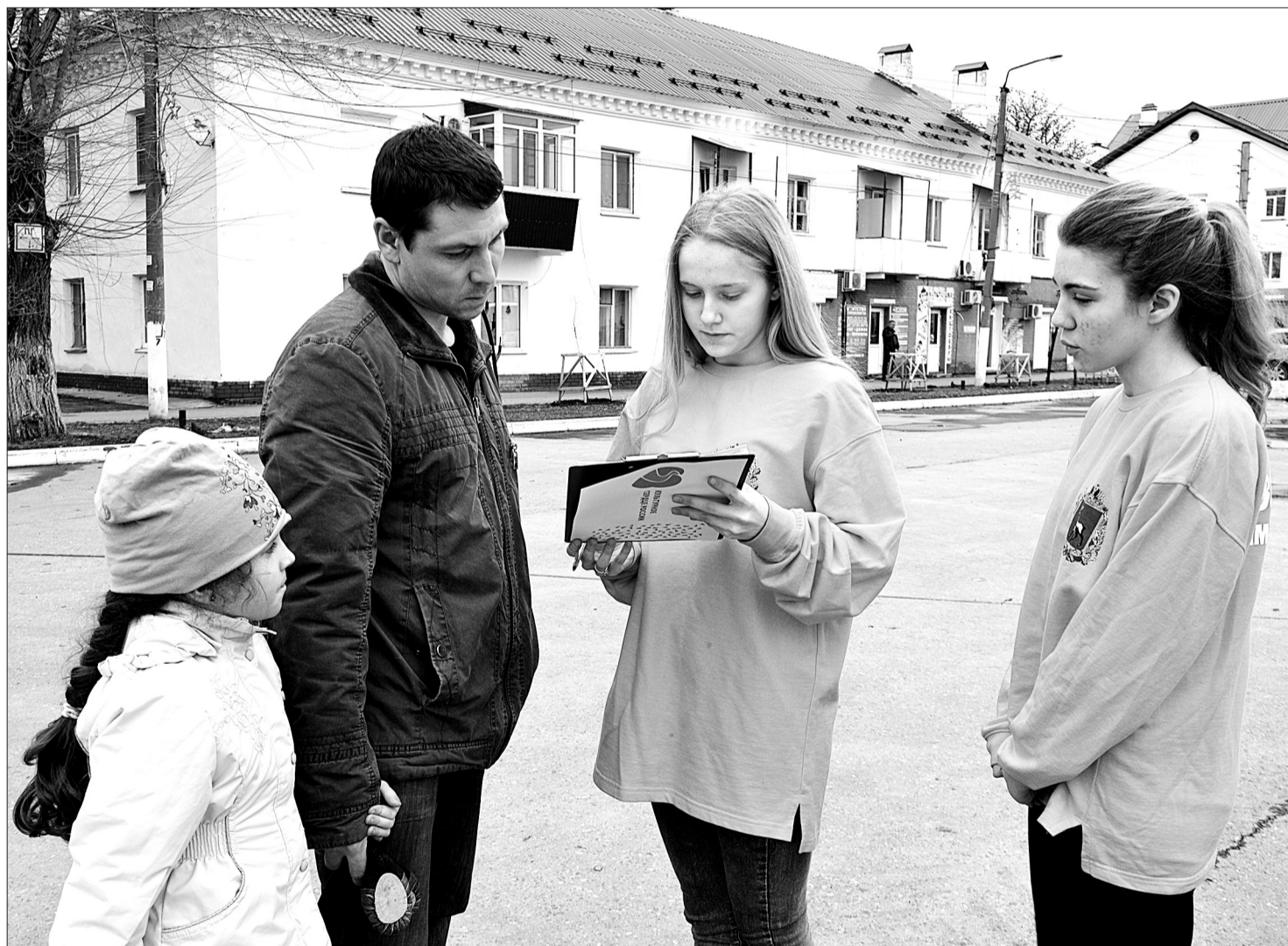
Анкетирование жителей в рамках проекта продлится до конца этой недели.

ГОРОДСКОЙ ОКРУГ КИНЕЛЬ ВКЛЮЧИЛСЯ В РЕГИОНАЛЬНЫЙ ОБЩЕСТВЕННЫЙ ПРОЕКТ «КУЛЬТУРНОЕ СЕРДЦЕ РОССИИ»