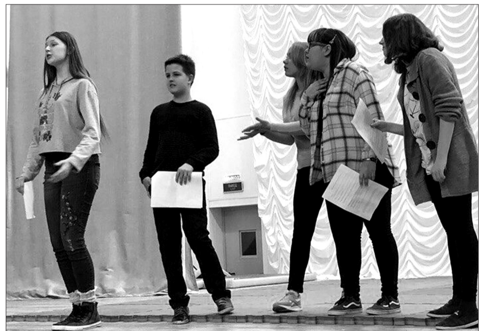
Идет репетиция нового спектакля. Участники театральной студии «Трюмо» готовятся к премьере.

совместительству, занималась вокалом с детьми (она окончила музыкальную школу).