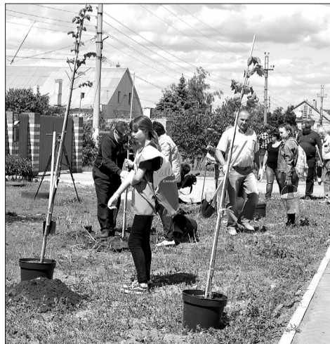
В последние годы стали проводиться большие работы по озеленению улиц и общественных мест.