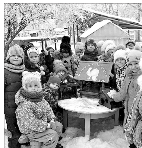
Воспитанники детского сада «Золотой Петушок» внесли свою лепту в облагораживание Каменного Дола.