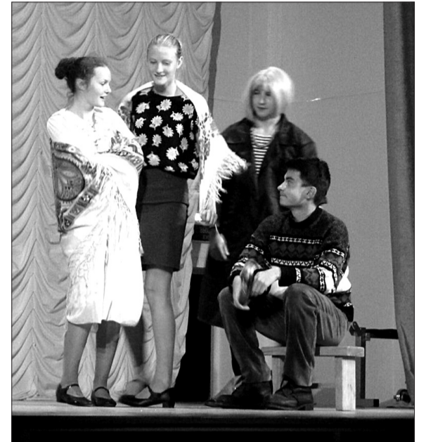
Сцена из спектакля «ОтДушиНа» по рассказу В. М. Шукшина.