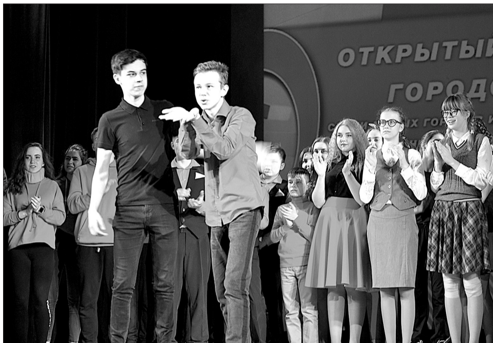
За теплую атмосферу команды поблагодарили зрительный зал воздушным поцелуем.

никами Школы КВН Городского Дома культуры - командами «Консервы» и «Монетка». Открытый Кубок для наших ребят стал продолжением весеннего марафона. В середине марта они приняли участие в финале первенства Северо-Восточного дивизиона Юниор-лиги КВН Самарской области, где «Консервы» вместе с еще одной кинельской командой «Останкино» стали победителями игры.