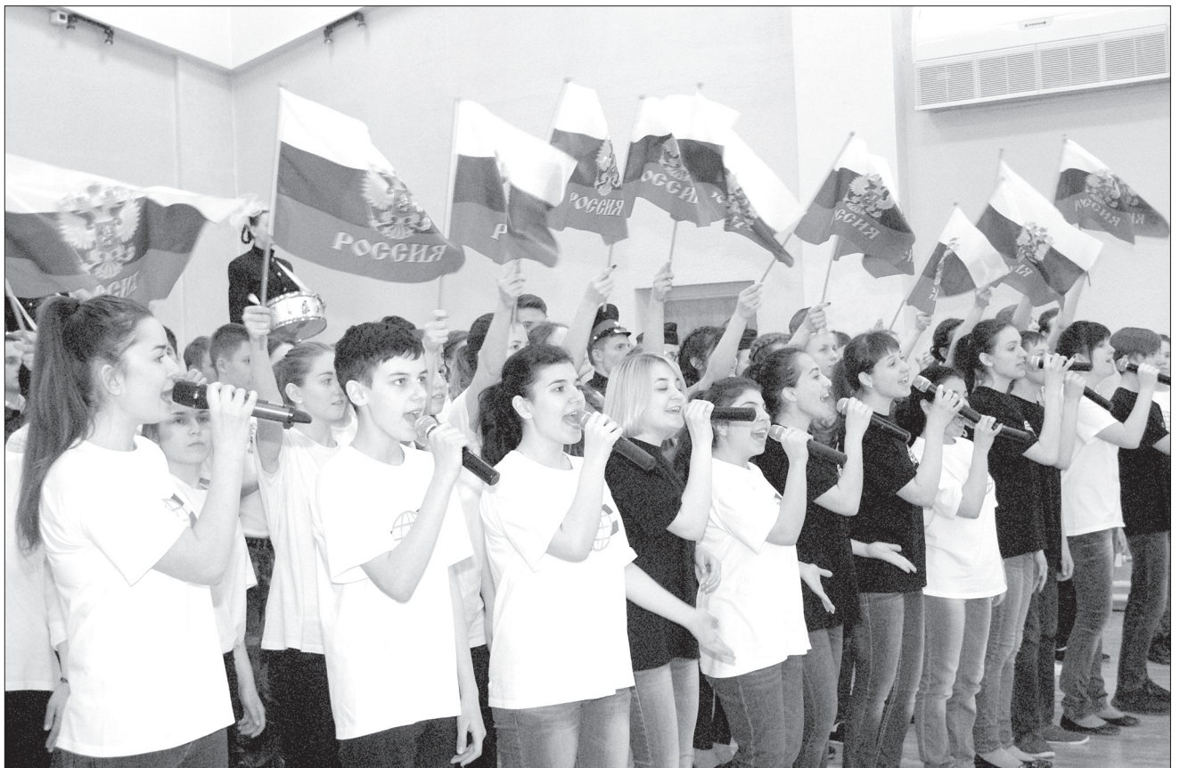
Яркое выступление активистов молодежных организаций отражало тему актуального разговора.

ЗАСЕДАНИЕ ПАЛАТЫ ГЛАВ ГОРОДСКИХ ОКРУГОВ САМАРСКОЙ ОБЛАСТИ СОСТОЯЛОСЬ В КИНЕЛЕ