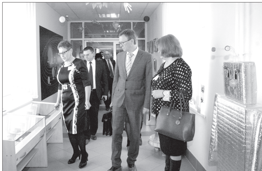
Как ведется работа по патриотическому воспитанию в «Городе Детства», гости Кинеля увидели во время экскурсии по дошкольному учреждению.

С газетой впечатлением от увиденного и услышанного поделился глава городского округа Сызрань