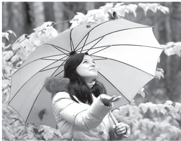
Наслаждаясь чудесной осенней погодой, позаботьтесь о своем здоровье.

1 столовую ложку эхинацеи залейте 2 стаканами кипятка и оставьте в термосе на 10 часов. Процедите и пейте по 1/4 стакана в течение дня до еды.