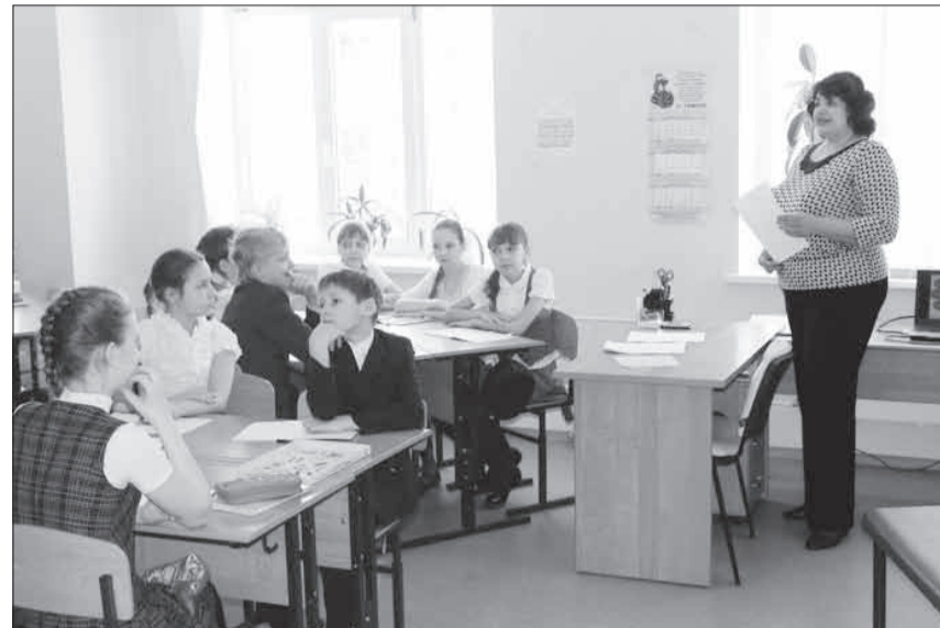
Задача учителя - привлечь к своему предмету и нацелить на достижение высокого результата.

- Последние три года на уровне Кинельского образовательного округа проводятся этапы Всероссийской олимпиады школьников, которые позволяют выявить одаренных детей. Как мы уже заметили выше, именно на них проявляется склонность учеников к тем или иным предметам. Есть у нас и собственная находка - на уровне округа проводим олимпиаду для младших школьников. Таким образом, дети уже с начальных классов