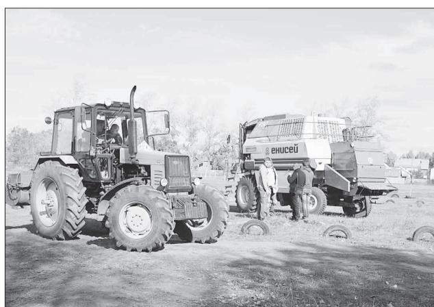
На практических занятиях студенты профессий сельскохозяйственного профиля под руководством опытных мастеров обучаются мастерству вождения современной сельхозтехники - тракторов и комбайнов.