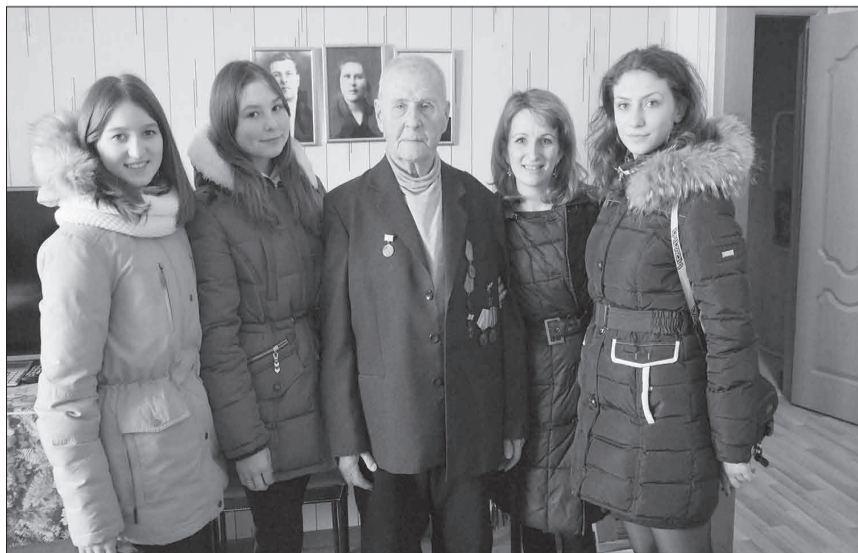
Встреча с ветераном Великой Отечественной войны.

Видимо, для педагога работа - это жизнь. Интересная, наполненная яркими событиями. Хорошо, что наших детей обучают и воспитывают такие целеустремленные, энергичные педагоги, способные зажечь учеников, увлечь своим жизненным миром познаний и открытий.