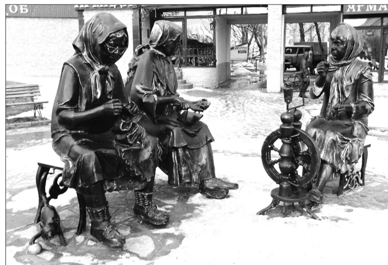
В Урюпинске много знаковых мест, среди них - памятник «Рукодельницы».