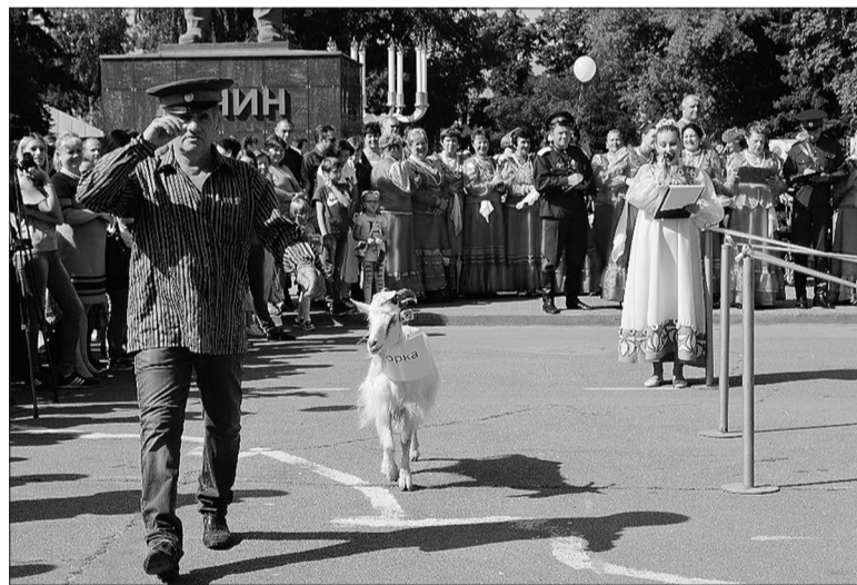
Один из символов города - Коза, ей на юбилей самое почетное место.