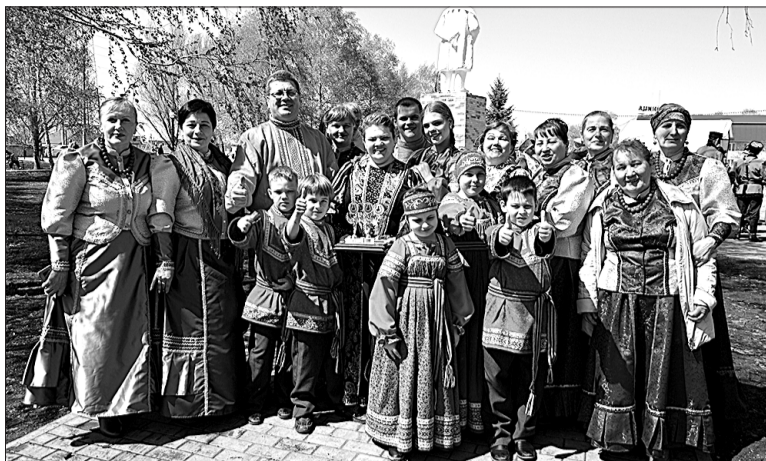
Коллективы «Мирница», «Миринка», «Соловушка» приехали в Алексеевку на фестиваль из Красноярского района.