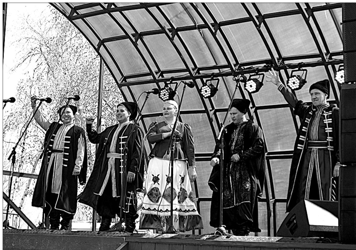
В календаре культурной жизни городского округа Кинель фестиваль займет свое место.

«Миринка» - частый гость творческих встреч в Алексеевском Доме культуры «Дружба», ансамбль - лауреат таких известных фестивалей, как «Расцвела под окошком белоснежная вишня» и «Триумф», международных конкурсов