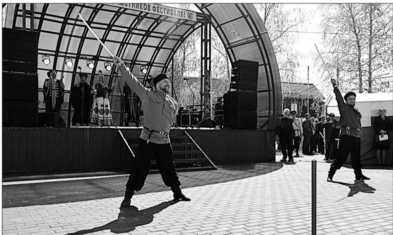
Удаль молодецкую да казачью, уверенно держа в руках стальные шашки, продемонстрировали гости праздника.