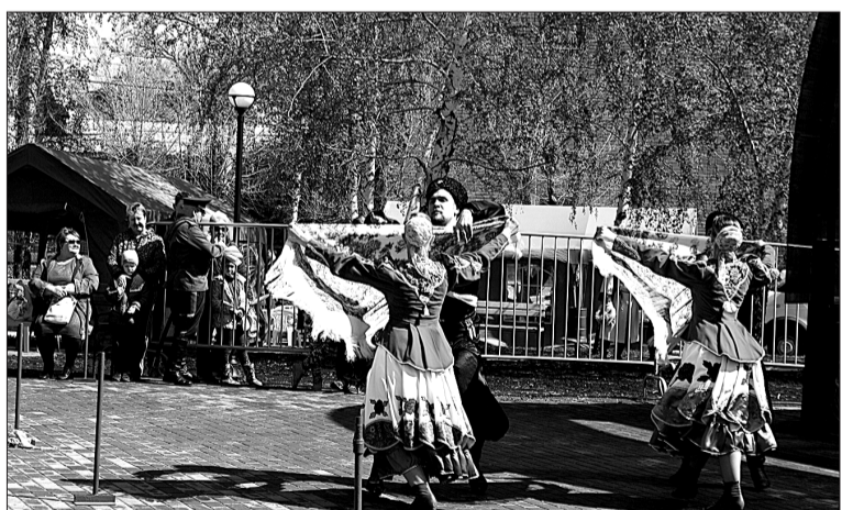
Задорные танцевальные номера участников фестивальной программы так и приглашали пуститься в пляс.