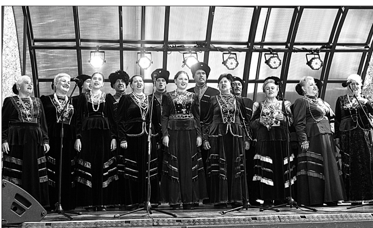
Именно исполнением казачьих песен народный ансамбль «Россы» полюбился зрителям.