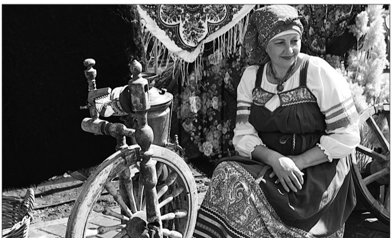
Всеобщее внимание привлекла фотозона, где были представлены элементы и предметы казачьего быта.