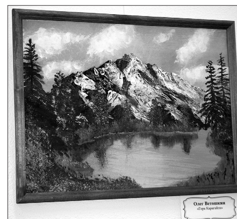
Олег Ветошкин «Гора Карагайла».