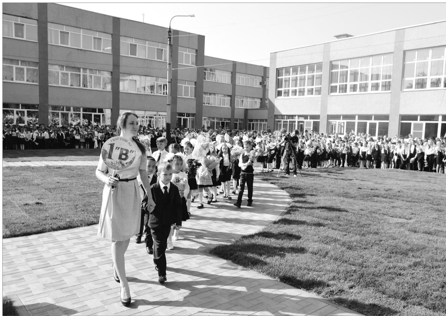
Школьная пора началась у главных героев праздника - первоклассников.

Передача избирательных бюллетеней состоится по адресу: г. Кинель, ул. Мира, 42 «а» (здание администрации городского округа Кинель) 7 сентября, в 10 часов по местному времени.