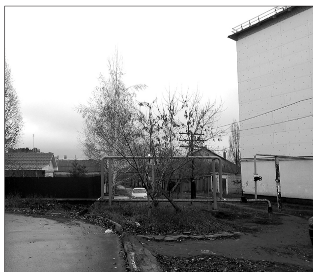
Ранее дорожка пролегла вплотную к жилому дому. В зимнее время путь здесь был небезопасным. Теперь арка расположена на расстоянии от стены жилого объекта, удален от непосредственной близости к дому и пешеходный участок.

Подготовила Мария КОШЕЛЕВА.