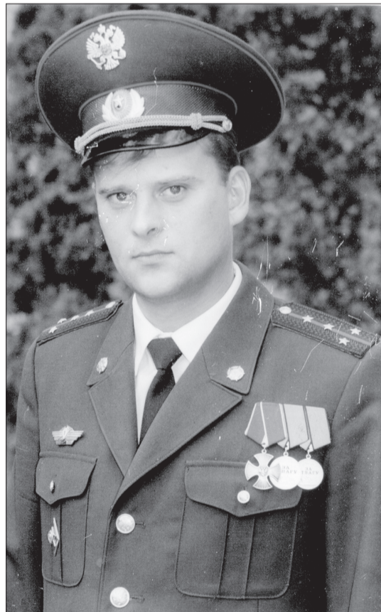
Кадровый офицер с боевыми наградами.

шили дерзкое нападение на заставу при поддержке огня из гранатометов, минометов и установок реактивных снарядов, заранее размещенных боевиками на ближних высотах. Пограничный пост в ходе боя был практически полностью разрушен. Российские пограничники 11 часов отражали атаки противника, после чего отступили, потеряв 25 человек убитыми. В тот же день застава была отбита. Позднее, по приказу Министра обороны РФ 12-я пограничная застава получила название «Имени 25 героев». Бой лег в основу художественного фильма «Тихая заставка».