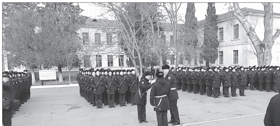
Курсанты Учебного центра ВМФ принимают военную Присягу. 4.02.2017.