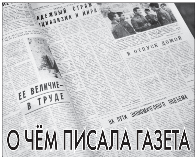
«Путь к коммунизму», 22 февраля 1986 года